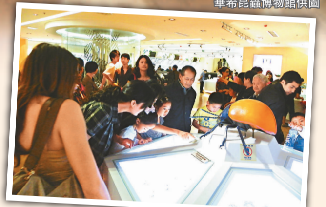
►華希昆蟲博物館成為孩子科普的好地方