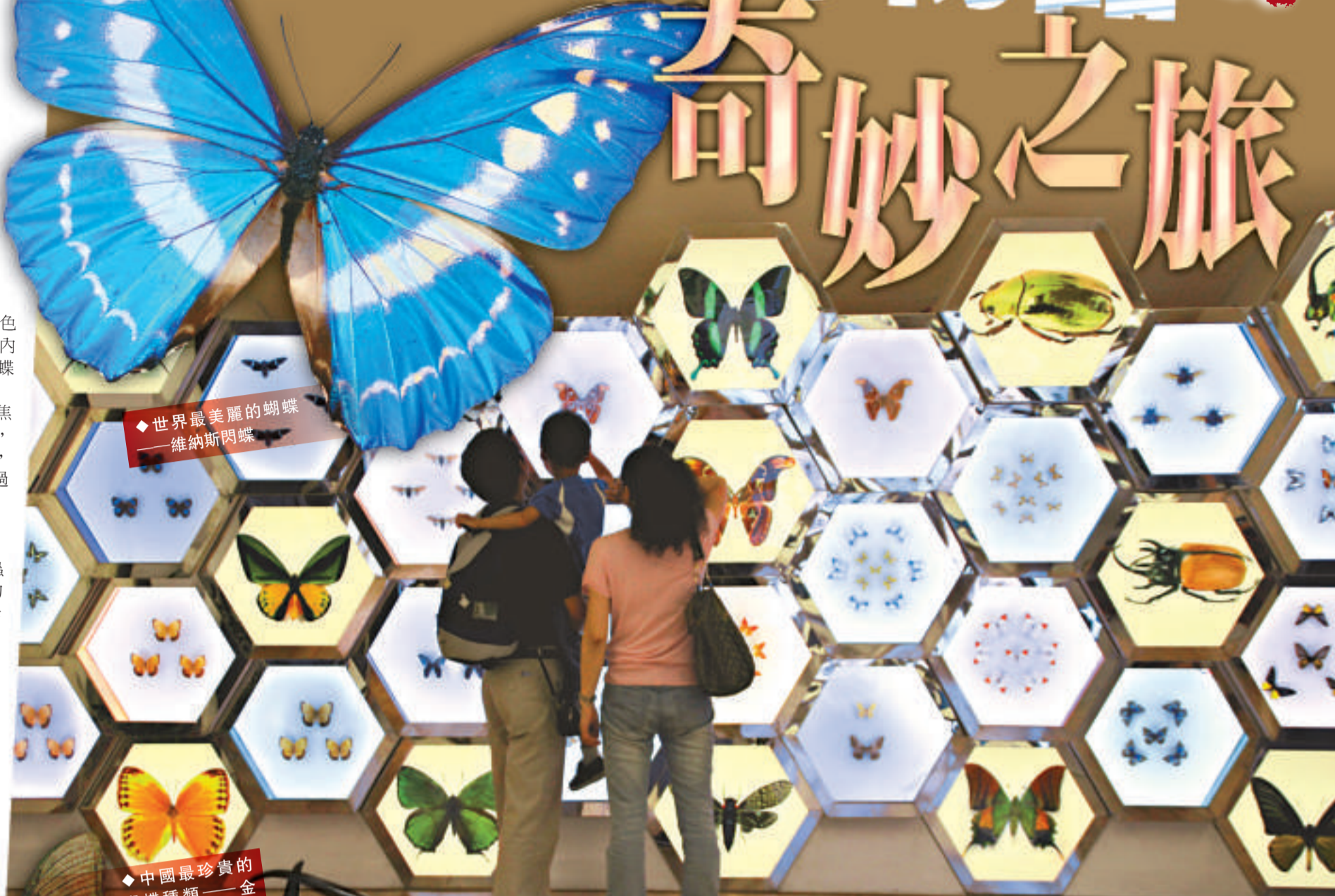
◆世界最美麗的蝴蝶——維納斯閃蝶