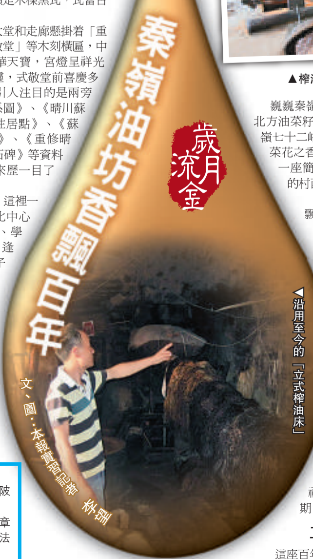
文、圖：本報記者 黃寶儀

旅遊TIPS： 交通：地鐵五號線車陂站 周邊景點：車陂公園、同章簡公祠、車陂法制文化廣場