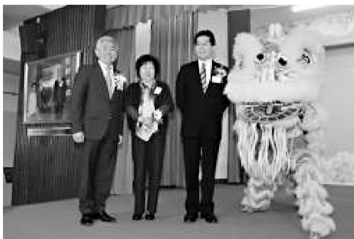
▲（左起）三水同鄉會禰景榮學校校長禰國全、麗晶教育中心校長張碧芳及商務及經濟發展局副局長蘇錦樑為校慶日的醒獅點睛

三水同鄉會禰景榮學校日前假學校禮堂舉行25周年校慶典禮，學校邀得商務及經濟發展局副局長蘇錦樑、教育局大埔區總學校發展主任陳輔民及麗晶教育中心校長張碧芳主禮。