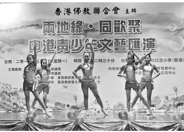
▲江西省南昌市星雨舞蹈隊為觀眾帶來的表演項目是群舞《火花》

香港佛敎聯合會屬小學：佛敎林金殿紀念小學及佛敎林炳炎紀念學校亦於同場表演，整個匯演共有15個表演項目，包括：舞蹈、武術、鋼琴獨奏等，透過精彩又深具意義的文藝表演，中港同胞、各界友好、莘莘學子、耆老稚子等聚首一堂，歡度了一個愉快的下午，共享佛誕的喜悦。