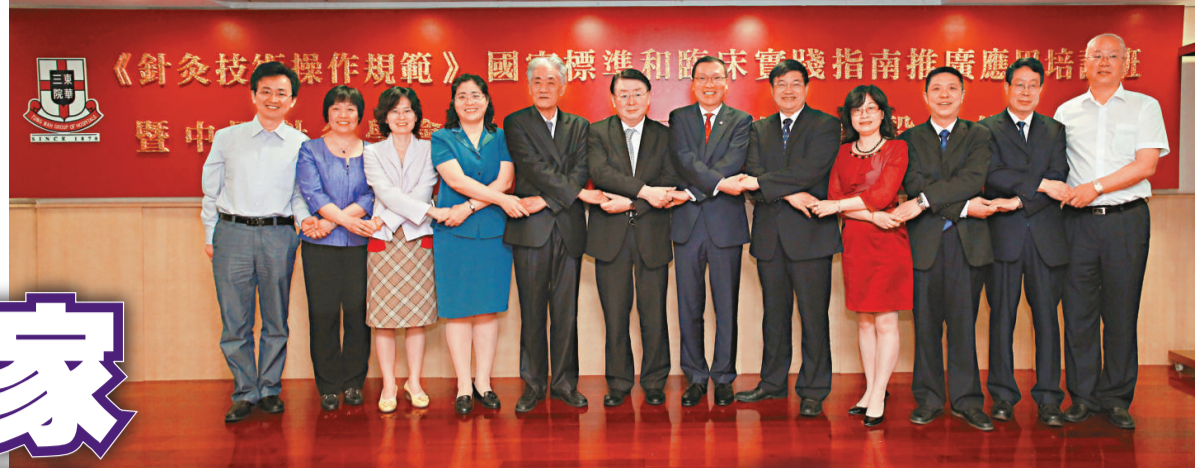
▲香港東華三院與中國針灸學會簽訂協議，成立中國針灸標準示範基地

中醫針灸治療，對於同一種疾病或症狀，醫師大多根據個人的經驗或者文獻報道作為臨床診療指導。隨着近年針灸在環球範圍的普遍使用，從臨床實際出發，也要求醫者運用循證醫學的方法，制定臨床應用的「指南」——即基本（正確）操作（技術）標準，在穴位（部位不同產生效果不同）、針法（操作步驟、方法、手法以至用針等，對療效和安全性關係密切）和針灸應用術語（統一表達方法、概念和定義）三個主要方面實行規範。 有中醫專家認為，循證醫學的最大作用，是幫助建立臨床實踐指南，對於推廣針灸治療和信息流通大有好處。