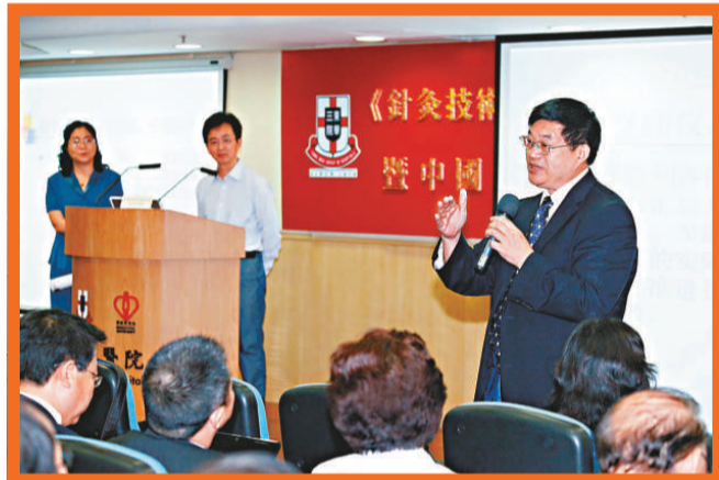
▲《針灸技術操作規範》培訓班在港舉行

劉保延教授補充，中國針灸學會和中醫科學院針灸研究所自2007年起，承擔了《WHO（世衛）亞太區循證針灸臨床實踐指南（草案）》的項目編制，已完成了上述五個病症的編制工作，去年又啟動了腰痛、痛經、坐骨神經等十個病症的針灸臨床指南和方法