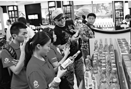
▲陸客參觀金門酒廠，飄香兩岸的金門高粱酒，成為血拚的伴手禮