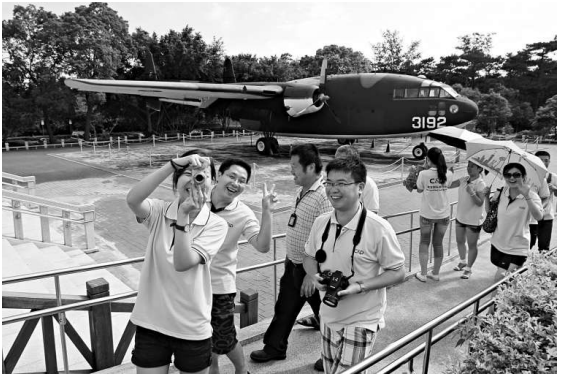
▲金門公園中山林園區陳展的骨董「老母雞」C-119運輸機，讓年輕陸客也感到新奇