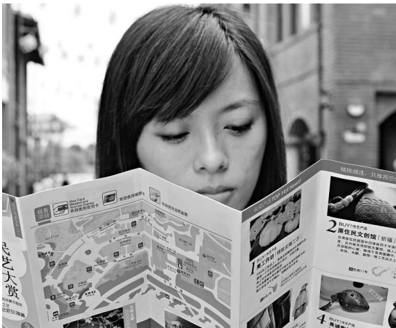
▲為迎接陸客自由行，宜蘭傳統藝術中心13日設計完成簡體字簡介手冊

【本報訊】據中央社13日報道：據島內知情人士說，陸客赴台自由行作業採取電子流程，陸客將證件、照片與個人旅遊簽證備齊後，交給大陸承辦旅行社，陸方旅行社再經電子程序，掃描陸客資料交給台灣