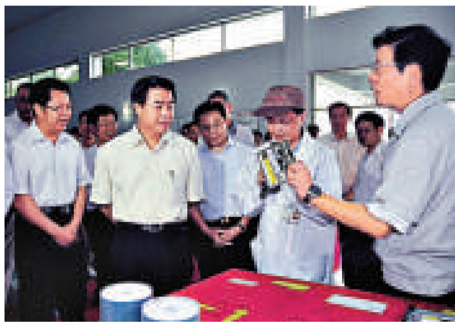
▲黃華華（前左二）14日來到先鋒高科技（東莞）有限公司調研，對該公司轉型升級的措施和成效給予充分肯定。左一為東莞市委書記劉志庚

黃華華在東莞期間先後深入寮步鎮、南城街道以及厚街鎮的工業企業，並與當地基層幹部以及企業家親切交談，共商東莞推動加工貿易轉型升級，實現又好又快的發展大計。