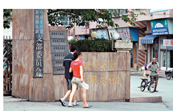
▲曾發生動盪的大敦村昨天已恢復了平靜