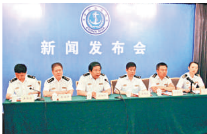
▲「中國海事航海圖書資料發行網站」在滬開通，將為電子海圖提供免費更新

與此同時，中國海事局重新組建了「上海海事局航海圖書印製中心」，由其代表中國海事局，承擔中國沿海紙海圖、電子海圖等的製作與發行，極大增強了上海國際航運中心的海事服務能力。