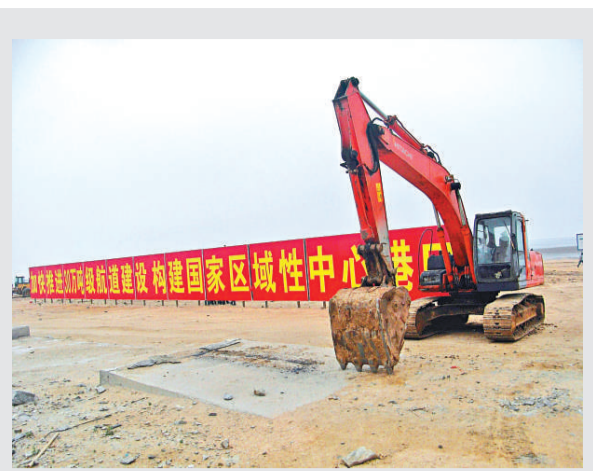
▲連雲港30萬噸級深水航道工地已樹立標語，為下階段碼頭興建打響口號

根據倫敦克拉克森統計數字，從全日本範圍來看，截至今年5月1日，日本船廠手持新船訂單共7130萬噸噸噸，而韓國是1.434億噸噸噸，中國是1.847億噸噸噸噸。