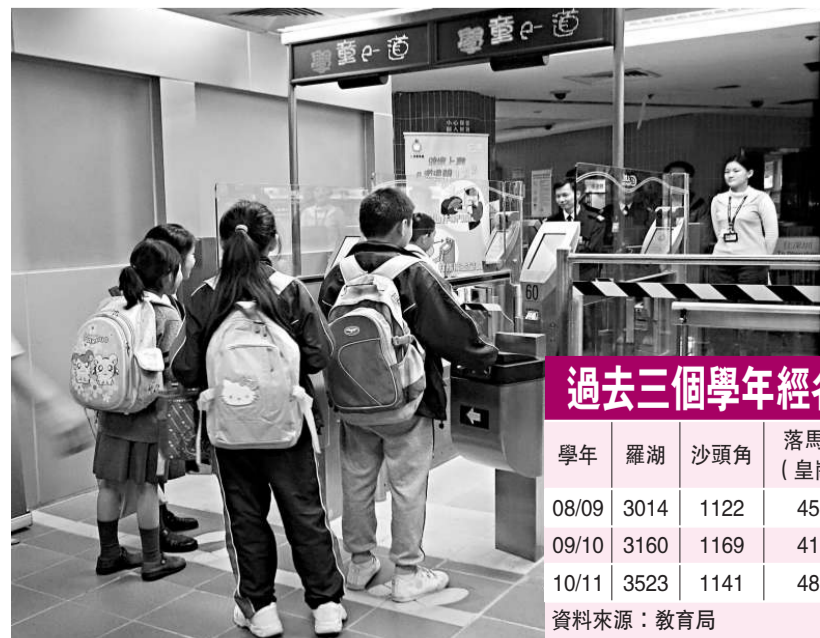
◀新學年跨境學童人數料破一萬大關

孫明揚表示，羅湖道擴闊工程預計在一一/一二學年內完工，可為有關路段提供雙線雙程的單車道，但接近驗檢大樓的路段因兩旁為斜坡和車站月台，受地理環境所限而未能擴闊，只可維持單線雙程行車。因此，擴闊後羅湖道的車容量因受單線雙程路段所限而不會有所增加，不適宜再增加校車班次進出羅湖道管制站。在羅湖道與落馬洲支線交匯處兩個口岸飽和情況下，政府已利用其他陸路口岸，包括文錦渡、深圳灣、沙頭角和落馬洲（皇崗）口岸以疏導跨境學童過境的需求。同時，新的蓮塘口岸初步設計，將會設有跨境校巴士落客區，供跨境學童使用，但詳情尚在研究中。