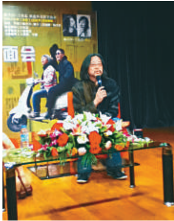
▲賴聲川在深圳介紹自傳劇

【本報訊】記者井欽聞深圳報道：賴聲川下月底將攜新戲《那一夜，在旅途中說相聲》到深圳保利劇院演出，他日前抵深為該劇預熱。這是其相聲劇系列的第七部，也是他第一部自傳體舞台劇。