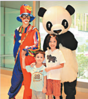
熊貓及小丑為小遊客帶來