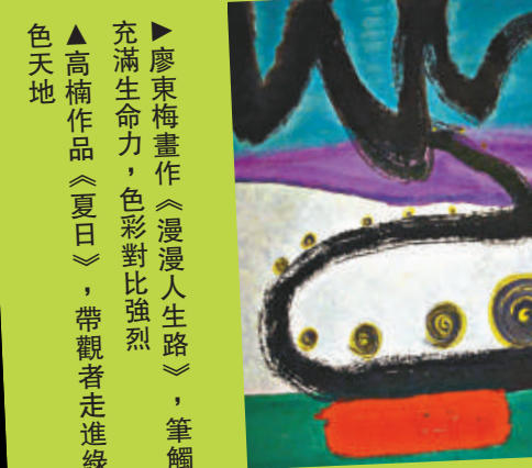
▲高楠作品《夏日》，帶觀者走進綠色天地