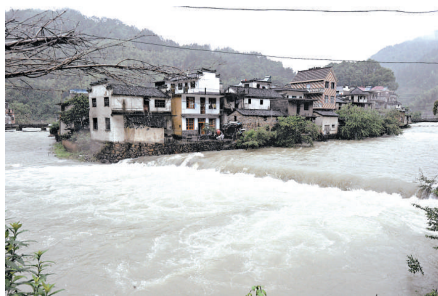
▲黃山市境內的新安江遭遇近二十年一遇洪水。受連續降雨影響，黃山市休寧縣古樓河水流非常湍急

汛，極有可能出現潮水頂托導致外江高水位持續不下的嚴峻形勢。當地政府確保沿江一線堤塘24小時有人巡查，對還在作業的船隻，及時告之避開洪峰，嚴禁捕魚頭魚。據浙江省水文局監測，自6月3日以來至16日19時，該省面雨量266毫米，錢塘江流域362毫米，其中錢塘江上游（衢州以上）444毫米，浦陽江流域385毫米，東苕溪流域341毫米。有785個站超過300毫米，單站雨量最大為淳安葉家源622毫米。受連續強降雨影響，錢塘江幹流及支流浦陽江發生全面超保證水位的流域性大洪水，東苕溪和錢塘江支流水等發生超警戒水位的洪水。鑒於錢塘江、浦陽江等流域汛情仍較嚴峻，浙江省防指繼續維持防汛Ⅰ級應急響應。截至6月16日18時，該省有9個市、43個縣（市、區）受災，受災人口209萬人。