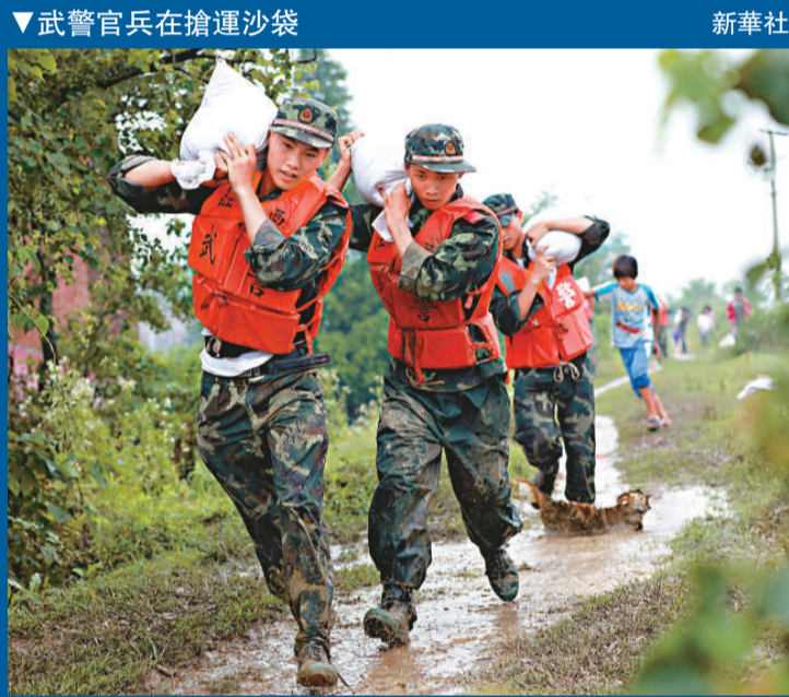
▼武警官兵在搶運沙袋