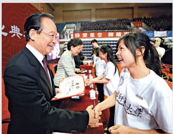
▲十七日，國務院總理溫家寶專程來到北京師範大學，出席首屆免費師範生畢業典禮。圖為溫家寶為優秀畢業生頒發證書