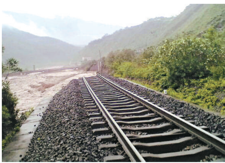
▲大暴雨導致成昆鐵路中斷

據新華社報道，水害發生後，鐵路方面立即啓動應急預案，有序組織落實滯留旅客生活、疏散等工作，保證滯留旅客有飯吃、有水喝和應急醫療。目前，鐵路部門已經組織2000餘名搶險救災隊伍和10餘台挖掘機等大型機械設備全力搶險。鐵道部有關負責人、專家技術人員及成都鐵路局搶險指揮部領導已趕往現場。其他在途旅客列車已安排折返。另據介紹，經成昆鐵路到昆明、攀枝花、西昌方向的旅客列車將調整運行計劃，鐵路部門提醒出行旅客注意車站公告。