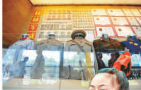
▲杭州舉辦紅色珍藏品展，展示各個時期的軍服