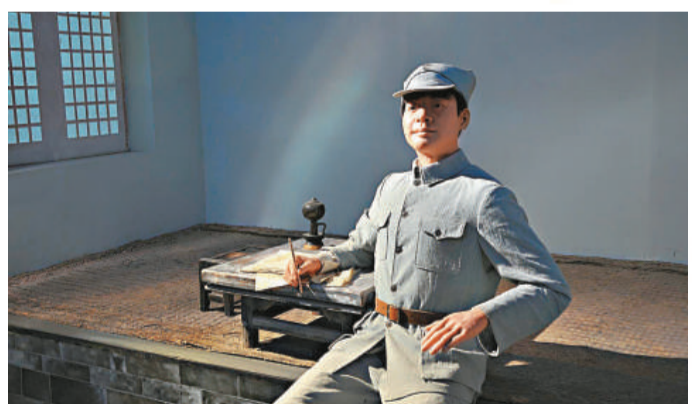
▲在《沒有共產黨就沒有新中國》紀念館裡的曹火星蠟像

夕陽西下，一輪紅日緩緩落入山間，前來「紅歌聖地」朝拜的一批批後人們，唱着這首熟悉的旋律，以激昂的歌聲下山。