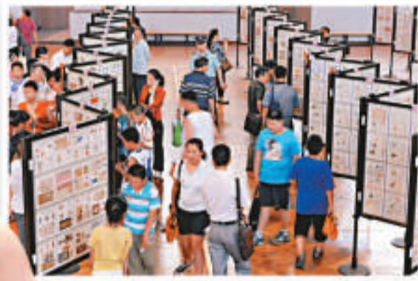
▲民眾參觀在濟南舉辦的慶祝中國共產黨成立90周年集郵展覽