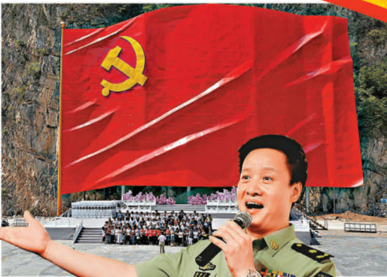
《沒有共產黨就沒有新中國》

沒有共產黨就沒有新中國，沒有共產黨就沒有新中國，共產黨辛勞為民族，共產黨他一心救中國，他指給了人民解放的道路，他領導中國走向光明，他堅持了抗戰八年多，他改善了人民的生活，他建設了敵後根據地，他實行了民主好處多。沒有共產黨就沒有新中國，沒有共產黨就沒有新中國，沒有共產黨就沒有新中國，沒有共產黨就沒有新中國，共產黨辛勞為民族，共產黨他一心救中國，他指給了人民解放的道路，他領導中國走向光明，他堅持了抗戰八年多，他改善了人民的生活，他建設了敵後根據地，他實行了民主好處多。沒有共產黨就沒有新中國，沒有共產黨就沒有新中國。