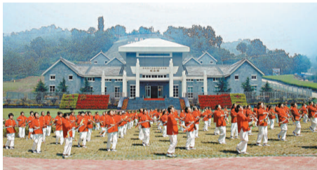
▲《沒有共產黨就沒有新中國》紀念館