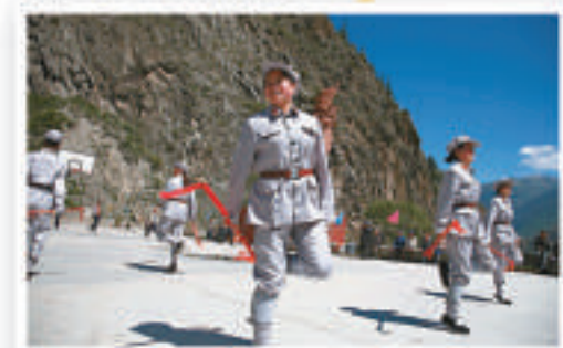
▲四川夾金山「紅軍」再展颯爽英姿

一間店舖的張小姐說：「開發票每套租金是43元，不開發票每套40元。若租數量多，租金可