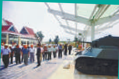
▲滇西抗戰使用過的坦克