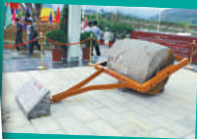
▲修建滇緬公路時留下的石碾