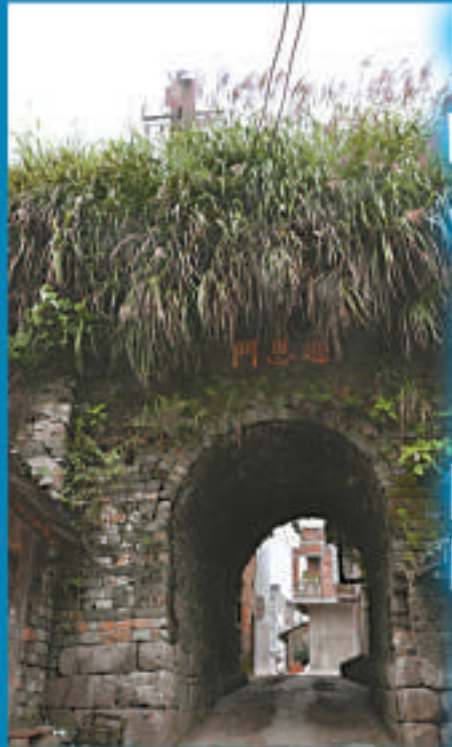
▲建於明朝洪武二十四年的古城門「迎恩門」