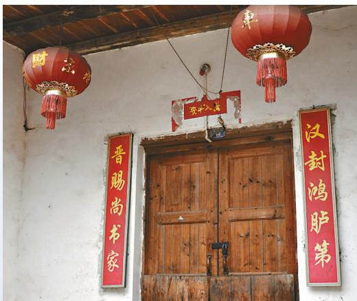
▲中山鎮家家戶戶門前貼掛的姓氏楹聯和郡望燈籠

此後，在清順治五年，由於當地客家人的誓不降清，中山鎮遭到清軍三次屠城，幾變為一座空城。平定後，清朝大量移民開發該地，加之倖免於難的中山人懷念故土紛紛回遷，使得中山百家姓聚居的情況最終形成，並延續至今。