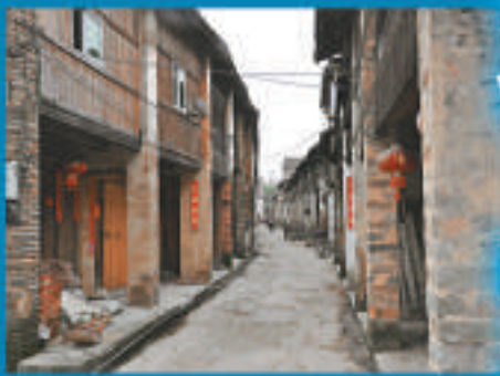
▲中山鎮內的千年古街