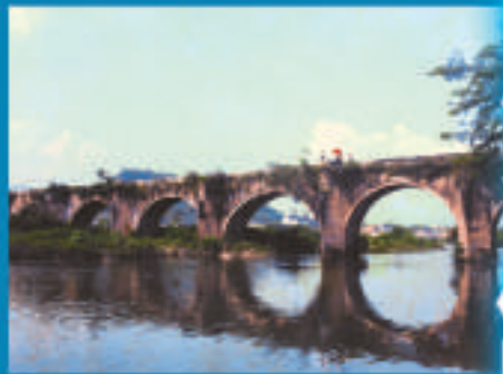
▲中山鎮千年古橋永安橋