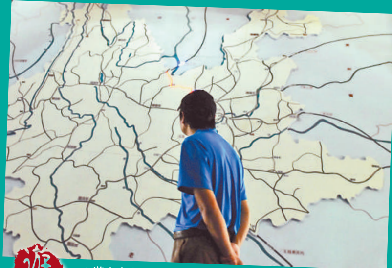
▲遊客在參觀公路館內的雲南省公路網現狀電子圖