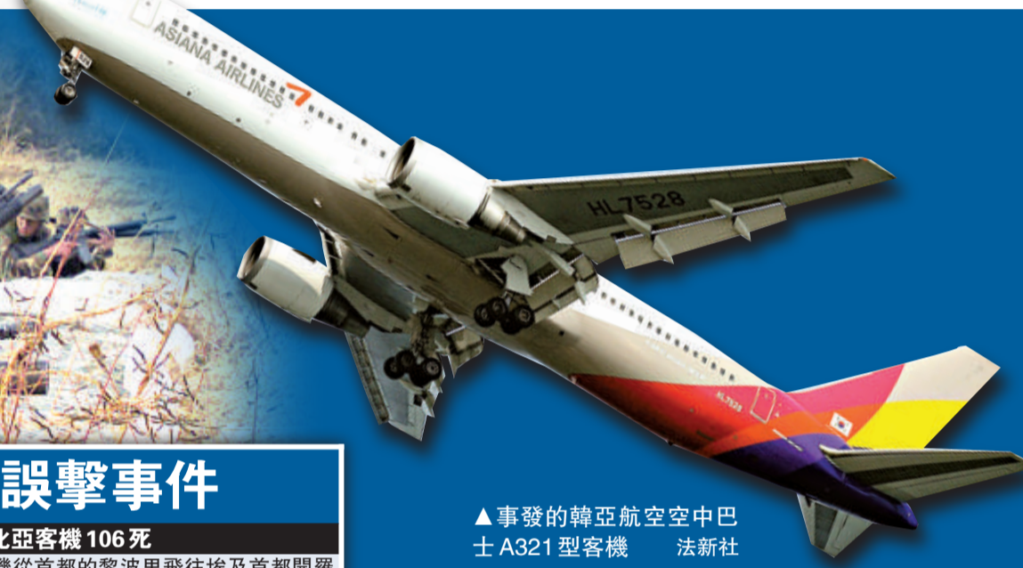
▲事發的韓亞航空空中巴士A321型客機