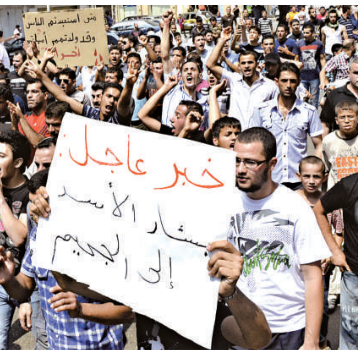
▲黎巴嫩示威者17日上街支持敘利亞反政府運動