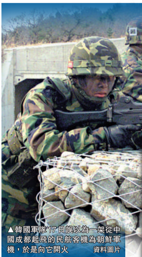
▲韓國軍隊17日誤以為一架從中國成都起飛的民航客機為朝鮮軍機，於是向它開火

國士兵已接到通知指，朝鮮可能會作出挑釁行為。韓國國防部長官金寬鎮曾對前線士兵說，如果朝鮮作出攻擊，他們應該立即還擊，而毋須等待最高指揮官下令如何回應。傳媒援引金寬鎮3月在西部前線視察時說：「不要問指揮官應否還火。要先行動，再報告。」