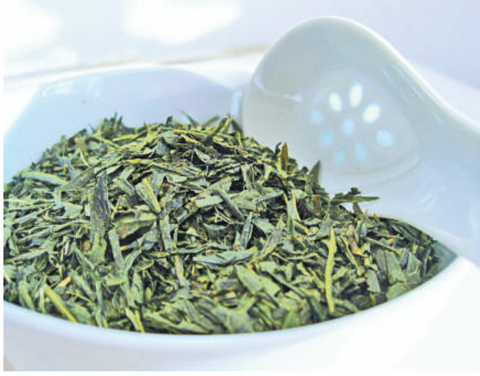
▲法國驗出進口的日本綠茶放射性銫含量超標