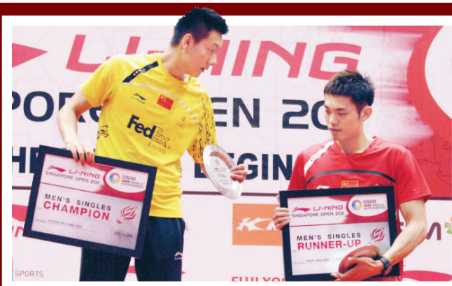
▲陳金(左)與林丹分膺新加坡超級賽男單冠、亞軍

汪鑫在決賽以直落兩局21：19、21：17擊敗丹麥名將鮑恩，成功封后，並將兩人的對賽往績改寫為7：0。男雙決賽由中國的蔡賢/傅海峰對印尼組合尤里安托/古納萬，結果前者以21：17、21：13擊敗對手摘冠。女雙方面，田卿/趙蕩蕩以21：13、21：16擊敗韓國組合河貞恩/金旼貞，捧走冠軍。混雙則由印尼組合奪得。