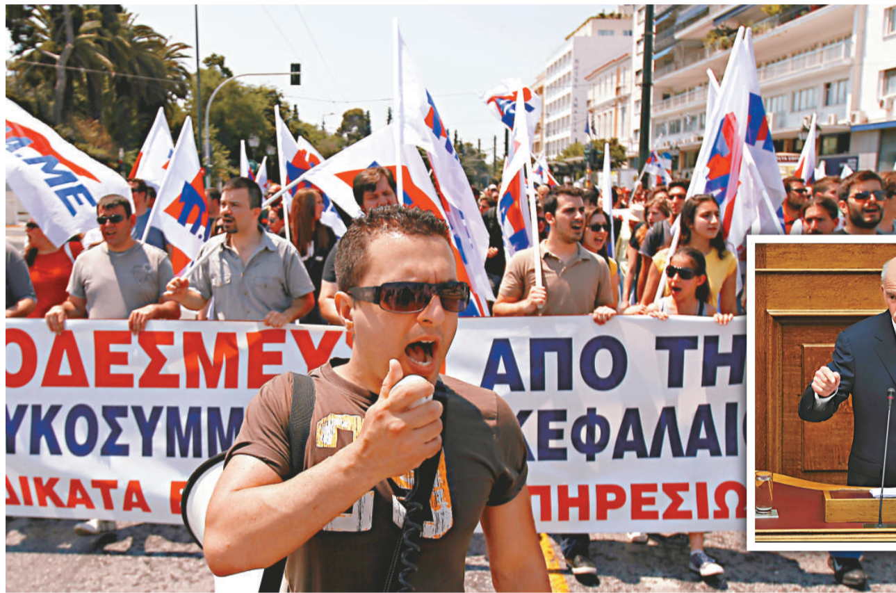
◀希臘民眾 18 日在雅典示威，反對財政緊縮計劃

【本報訊】據法新社雅典 19 日消息：歐盟財長 19 日在盧森堡舉行會議，討論向希臘批出新援助方案，以解決債務危機。希臘總理帕潘德里歐星期日則呼籲國民支持財政緊縮計劃。帕潘德里歐組織了內閣，有待國會周二表決。