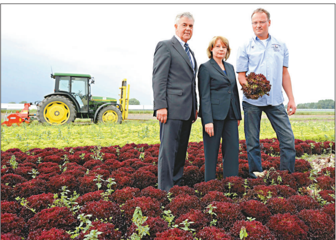
▶德國漢堡的衛生局長施托克斯(中)16 日視察漢堡一處農田

防疫部門應盡早就如何持久消滅病菌制定對策。 卡希還說，他領導的研究團隊已發現引起此次疫情的 O104:H4 型大腸桿菌具有很強的聚集黏附能力，即使人體外也能黏附在物體表面，並能生存較長時間。此外，這種病菌耐寒能力也較強。在實驗室冰箱中，研究人員設定了 5 攝氏度的低溫環境。自 5 月 24 日至 6 月 18 日，病菌樣品在這種環境中一直存活著。 德國大腸桿菌疫情近期明顯消退。德國衛生部長巴爾 18 日說，德國腸出血性大腸桿菌感染疫情「最嚴峻的時刻已經過去」，近期新增病例不斷減少，使人們有理由感到「謹慎的樂觀」。 德國民眾情緒也趨趨平靜。根據德國媒體 18 日公布的一項最新民調結果，85% 的德國人已重新開始購買黃瓜、番茄和生菜等蔬菜，它們在疫情爆發初期曾被懷疑為傳染源。