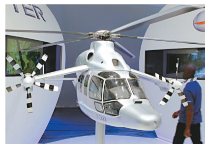
歐洲直升機公司最新設計的直升機 X3 模型在巴黎航展上亮相