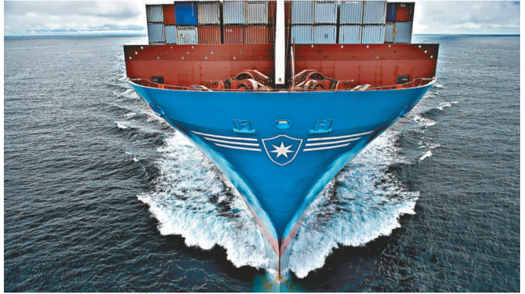
馬士基以船大運力足取得市場份額

燃油價格是班輪公司普遍最難應對之事，亦是蠶食利潤的罪魁禍首，赫伯羅特航運主席賓倫特 5 月 12 日在業績公布會上講出班輪業目前三大難題：一是高