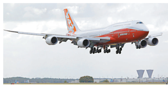
波音 747-8 洲際客機昨日飛抵布爾歇機場