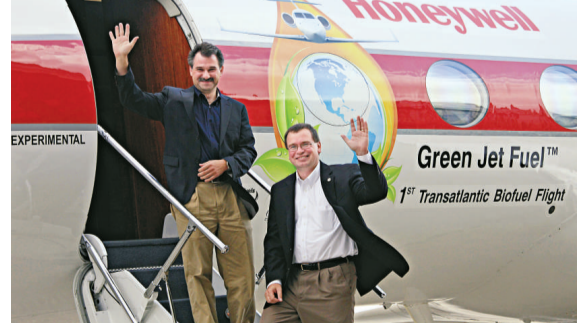
全球第一架在泛大西洋航線上使用生物燃料的支線飛機

第 49 屆巴黎國際航空航展展覽會將於今日至 26 日一連 7 日在布爾歇舉行。展望本次航展，有三大特點：新能源飛機成爲亮點；傳統飛機製造公司以新面貌示人；中國航空航企作爲新勢力在國際舞台上集體亮相。