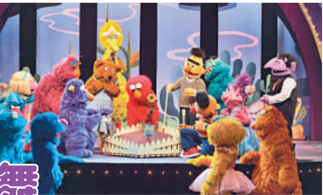
▲舞台劇版《芝麻街》將在內地多個城市巡演

【本報訊】記者井欽聞深圳報導：艾摩、大鳥、甜餅怪……「芝麻街」上耳熟能詳的明星將亮相深圳舞台。本月二十八日至三十日，舞台劇版《芝麻街》將亮相深圳保利劇院，帶來其舞台劇最初三部作品之一的《艾摩的開心花園》，並開始為期兩個月的中國巡演。