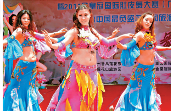
▲卡瑪舞蹈培訓機構表演的《卡瑪之蓮》 本報攝

此外，每逢週末，「大地之舞」等蓮花舞蹈及魔術師表演將在愛蓮亭內輪番上演，豐富文化節的內容。蓮花節歷時兩個月。主辦方繼續引進二十多個蓮花新品種，品種達四百個，創歷屆之最。結合本屆蓮花節主題，挑選出醉舞、舞妃蓮、中國古代蓮、桃花扇、漢宮秋等珍貴品種，製作出主題為「蓮花開，舞起來」、「高山流水蓮花情」等蓮花小品供遊客觀賞。近幾年來，已先後發現罕見的白色中山蓮等多株並蒂蓮。