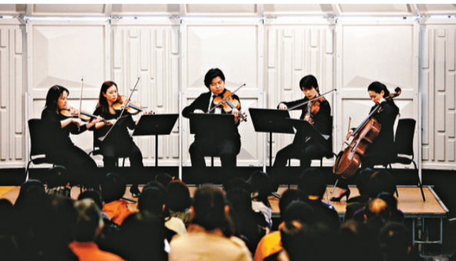
▲「小交」在大會堂大堂舉行午間音樂會

「懷舊與想像——胡永凱作品展」展期至七月八日。查詢電話：27369623，網址：www.wanfung.com.cn。