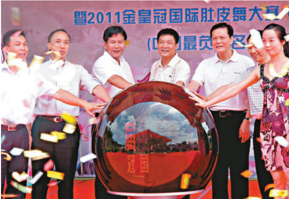
▲蓮花旅遊文化節開幕現場