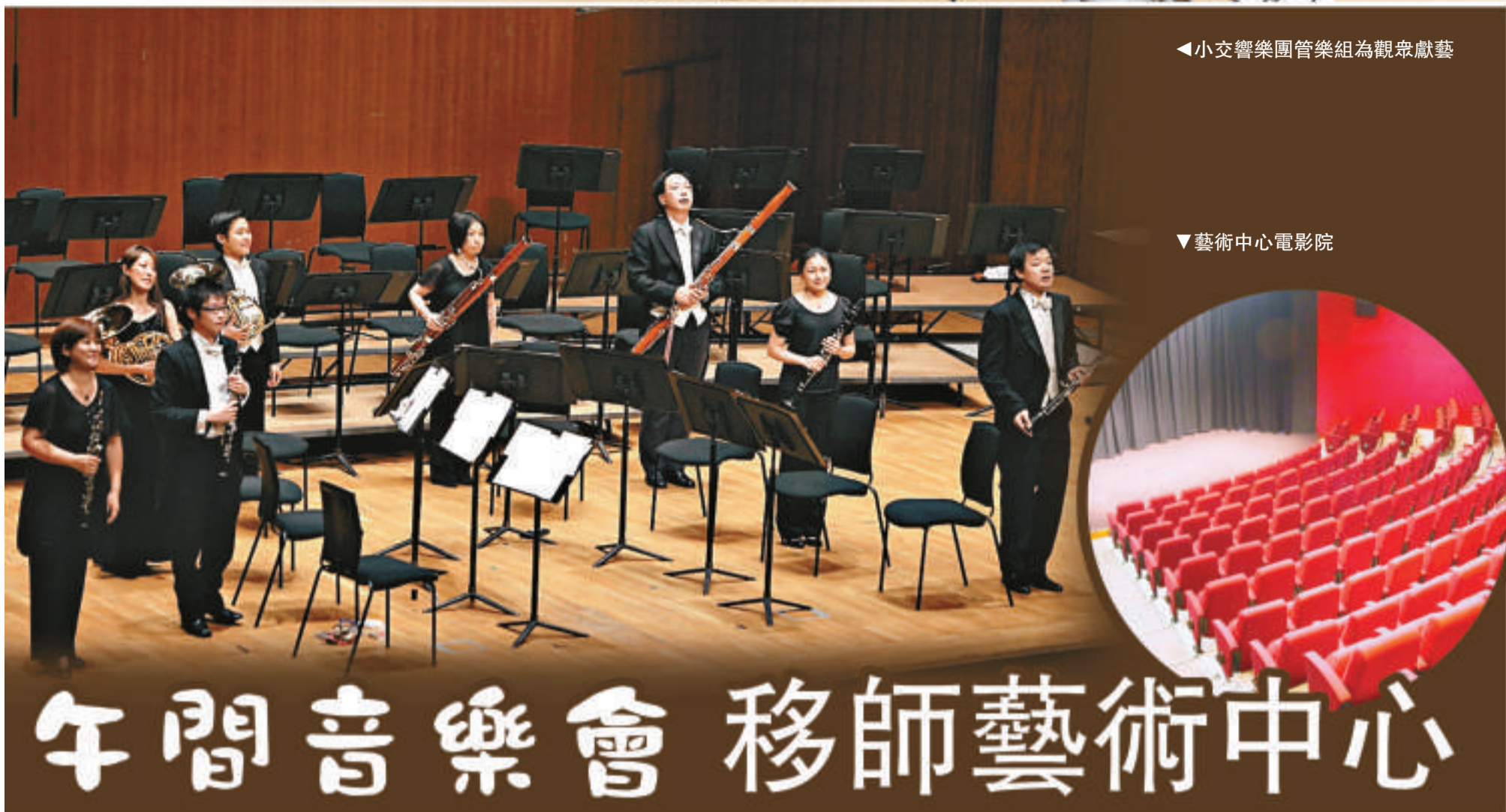
小交響樂團管樂組為觀眾獻藝