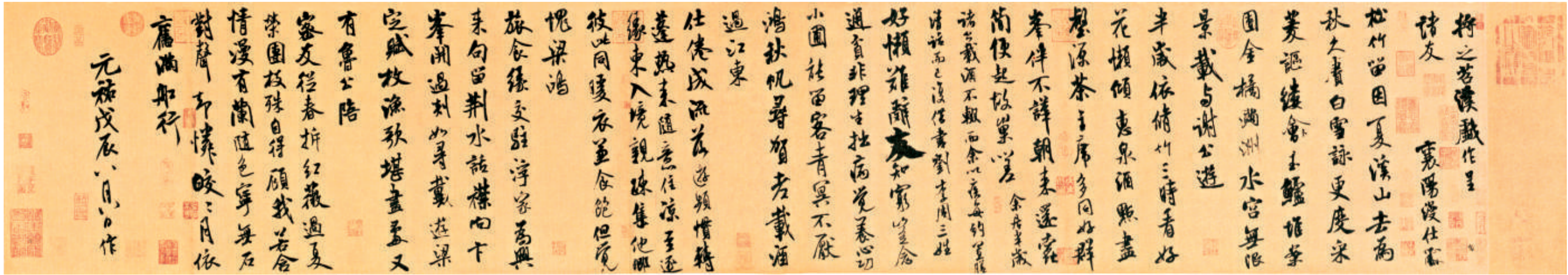
《茗溪詩》 宋 米芾書