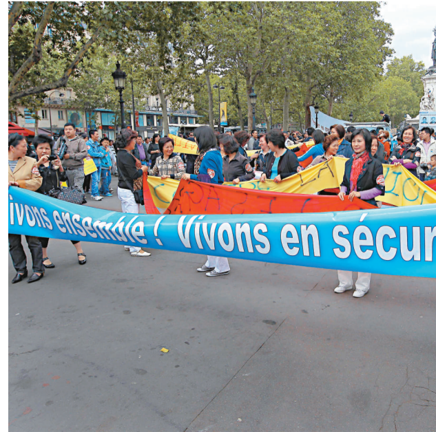
▲旅法華僑華人十九日在巴黎遊行，抗議針對華人的暴力行為

這次主題為「安全、權利」的集會遊行得到了巴黎警方的批准。遊行隊伍於當日十五時從巴黎共和國廣場出發，