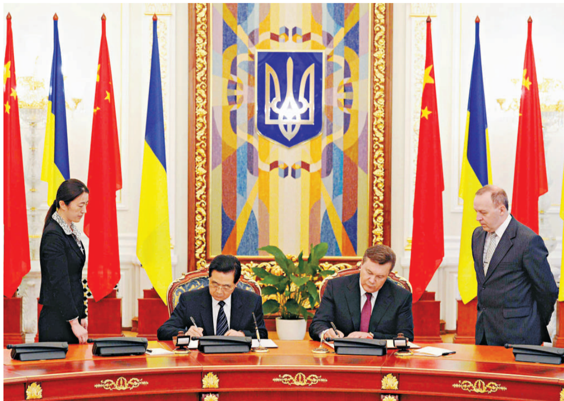
▲中國國家主席胡錦濤二十日同烏克蘭總統亞努科維奇在基輔共同簽署聯合聲明