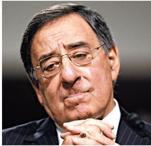
▲美國中情局局長帕內塔本月9日出席參院聽證會

【本報訊】據中通社華盛頓21日消息：美國國會參議院21日通過總統奧巴馬對中央情報局局長萊昂·帕內塔擔任國防部長的提名。帕內塔將接替即將卸任的羅伯特·蓋茨，成為新一任國防部長。