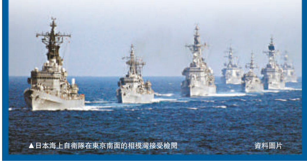
▲日本海上自衛隊在東京南面的相模灣接受檢閱