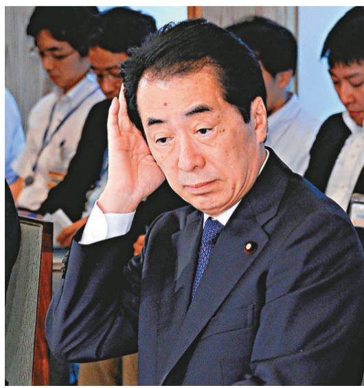
▲日本首相菅直人22日出席國會會議

民主黨內部分議員依然強烈要求菅直人盡快辭職，並希望他最遲不能拖過今年8月。但是，菅直人始終不願意說出自己計劃辭職的具體時間表，令日本政局始終處於不安定的狀態。