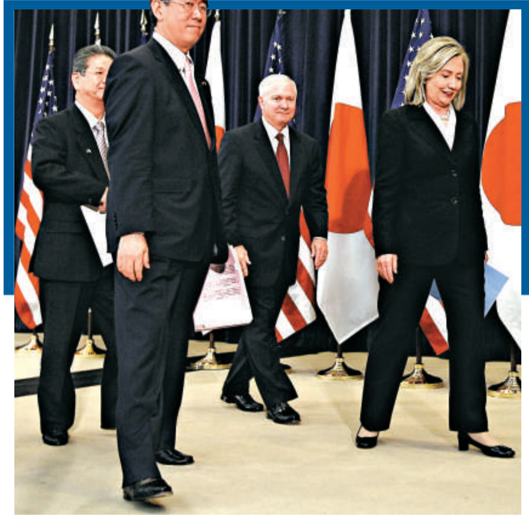
▲（左至右）日本防衛大臣北澤俊美、日本外相松本剛明、美國防長蓋茨和美國國務卿希拉里講述美日共同戰略目標後離去

中國2011年度國防開支約比2005年度增加了約1.5倍。據日本外交消息人士透露，美日雙方一致認為「地區安全環境趨於嚴峻」。