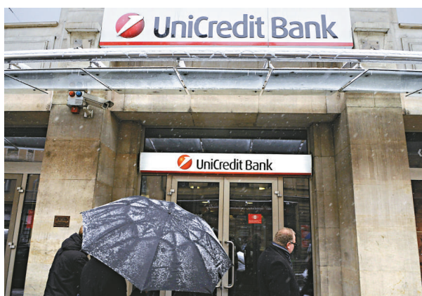
▲受穆迪可能調低意大利評級影響，意銀行股周五急跌，一度停盤

意大利最大的聯合信貸銀行（UniCredit）領跌，股價一度跌8.9%，而資產第二大的Intesa Sanpaolo銀行，股價曾跌7.2%，兩隻股票曾經一度暫停買賣。