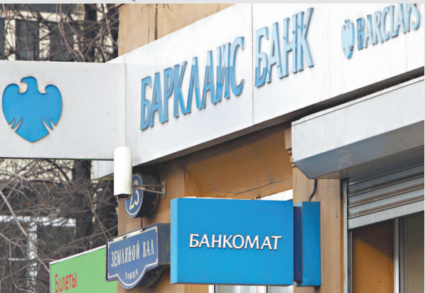
▲歐洲銀行管理局呼籲，銀行應減少持有高風險政府債券

歐洲銀行管理局3月開始進行壓力測試，目的為重建歐洲銀行體制信心，由希臘引爆的歐債危機伸延至葡萄牙及愛爾蘭，過去一個月希臘重組債務的揣測導致歐債危機惡化。