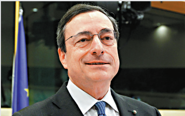
▲意大利央行行長德拉吉正式獲委下屆歐央行行長