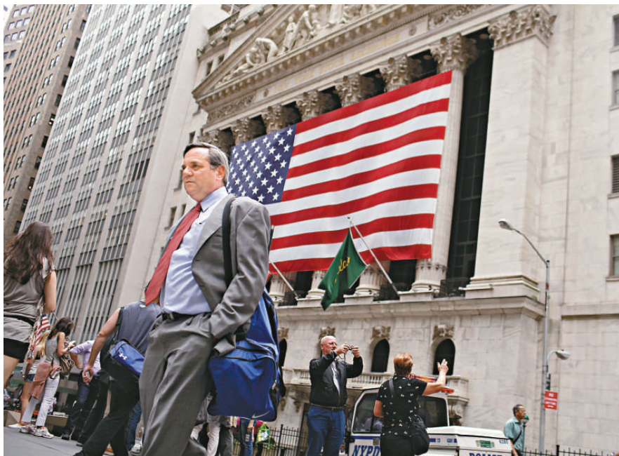
▲美公布修訂後GDP數據，首季錄得經濟增長1.9%，高於市場預期