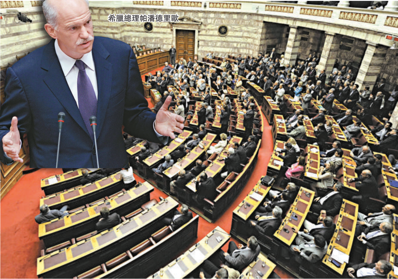
▲希臘與歐盟和IMF就緊縮協議達成一致，同意未來四年削減280億歐元的削赤方案，不過，該方案尚待希臘國會正式通過

歐盟準備向希臘施加更大壓力，呼籲希臘跨黨派支持政府的嚴苛削減開支計劃，該國最大反對黨領袖公開反對原