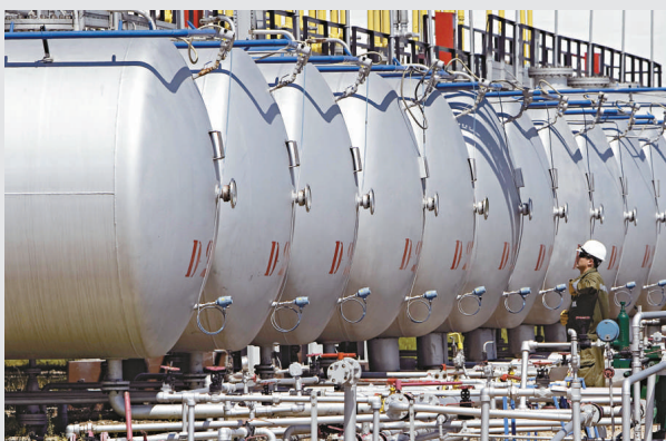
▲法興表示，油組料會維持油價不低於90美元水平

IEA表示，利比亞石油產量減少1.32億桶，因此需要釋放緊急石油庫存。法興指出，IEA釋放庫存原因是本土政治考慮，而不是利比亞問題，因為低油價有助美國及歐洲經濟復蘇。