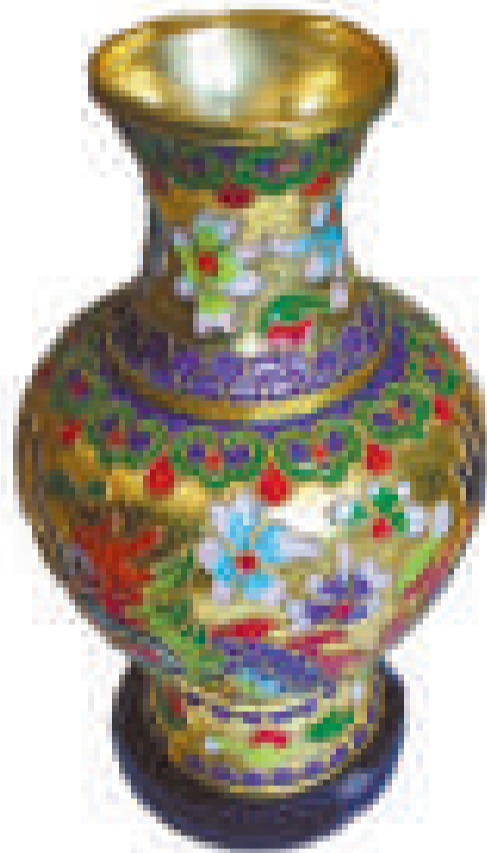
▲景泰藍也叫銅胎掐絲琺瑯，是北京著名工藝品