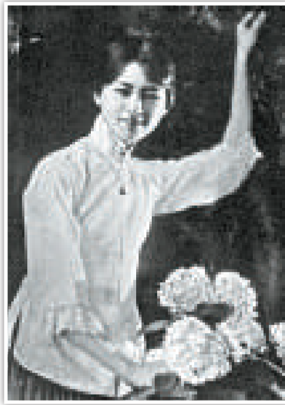
▲林徽因當年為拯救景泰藍製作工藝做了大量工作

林徽因把那些圖案指點給大家看：「中國的傳統圖案是這樣表現它的象徵意義的，世界上所有的民族、所有的文化也都有自己的象徵體系。中國的吉祥圖案就是一例，它源於周禮，始於秦漢，成熟於唐宋，興盛於明清。吉祥圖案以傳統的裝飾紋樣，通過自然現象的寓意、諧音或附加文字等形式，來表現人們的願望和追求。吉祥圖案的內