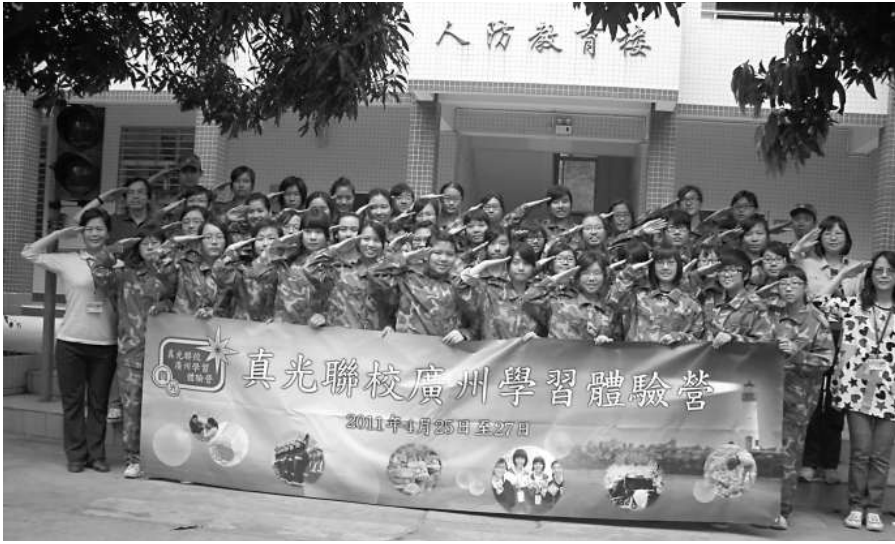
◀40名穿上迷彩服的真光女兒與4位真光校長在廣州勞動技術學校的人防教育樓前留影

晚上，真光同學與廣州市東圃中學的同學交流，大家很快便打成一片。隨後的遊戲時間更把整晚交流活動的氣氛推至高峰，開心萬分。交流結束之時，真光同學與東圃同學齊拍着「愛的鼓勵」，掌聲如爆竹聲，雄壯熱鬧。最後，以一聲洪亮的「真光」與「東圃」圓滿結束。