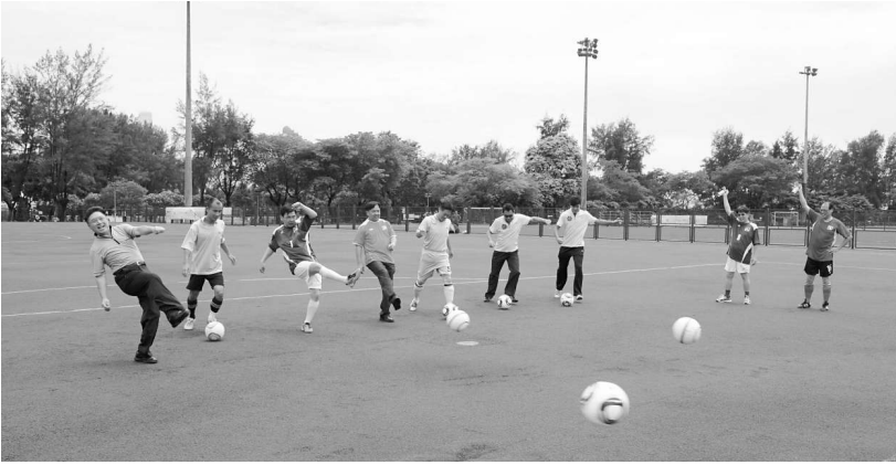
◀第四屆教師體育節壓軸項目：「足球嘉賓邀請賽」開球禮