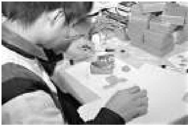
◀同學正親手造意式拼貼木盒送給父母，以「頌親恩」

是次工作坊很成功，學生皆興奮雀躍、專注地製作小禮物；校友、義工及家長們均表示非常享受參與其中。根據過往經驗，有參與製作的學生固然感到興奮，獲得精緻禮物的，無論是家長或老師皆感受到「物輕情意重」。因此，此類活動值得與其他學校分享，也值得向學界推廣，重申「孝道」、重視「人倫」。