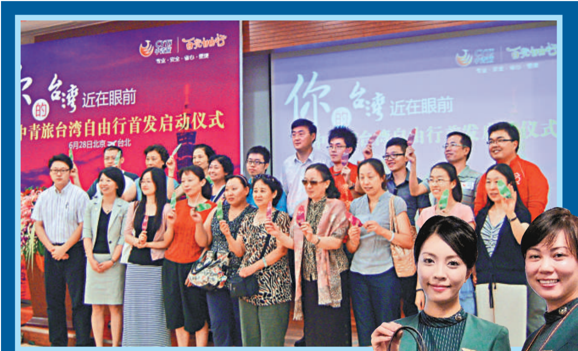
▲北京中青旅行社召開北京赴台自由遊行前說明會，首批團員合影。

▶有台灣航空業者將於 28 日送給每名大陸自由遊客購物袋，盼望陸客赴台時多血拚。