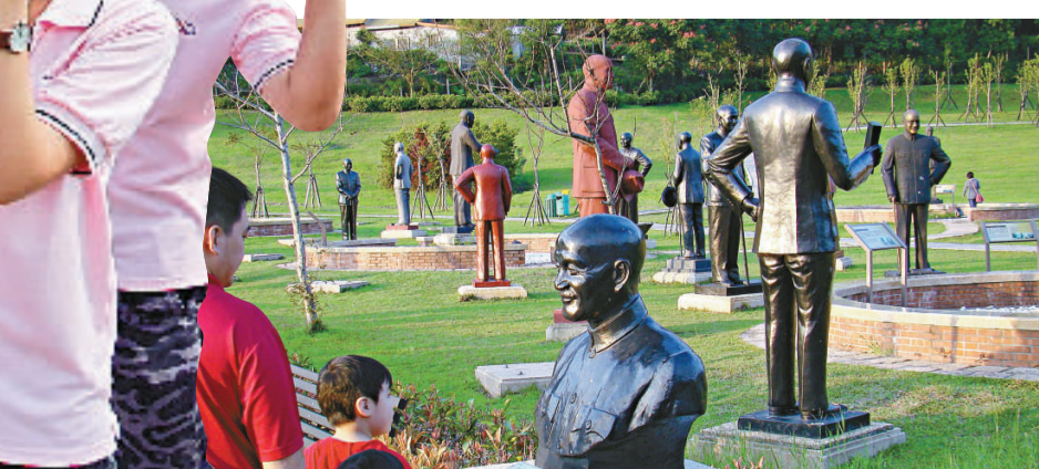
▲到台灣自由行的上海遊客希望多了解關於「兩蔣」的歷史。資料圖片

值得一提的是，雖然首批赴台個人遊的出遊費用較團隊遊增加約三成，但各家旅行社仍千方百計地向嘗到「頭啖湯」的遊客提供增值服務。錦江旅遊公司稱，旅行社將在機場接送、車輛租用、酒店入住、遊玩消費等環節給予遊客支持。青旅方面則在其線路特色中標註「台灣個人遊首發團，特享六大贈送」，包括贈送 1 張「101 大樓觀光票」、「機場接送加 DFS 免稅店」、「台北故宮半日遊加珊瑚博物館」等。