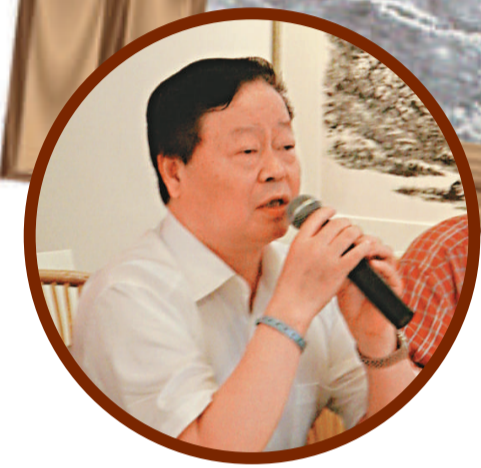
▲陝西省美術家協會主席王西京介紹本次展覽情況

，從此開始了以人民生活、革命歷史和黃土地為題材的繪畫藝術生涯。其作品描寫了陝北人民的特有個性和氣質，以及陝北的革命歷史和風土人情。