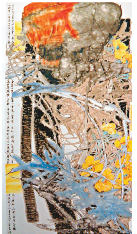
▲張昊《戰地黃花分外香》，二〇〇一年