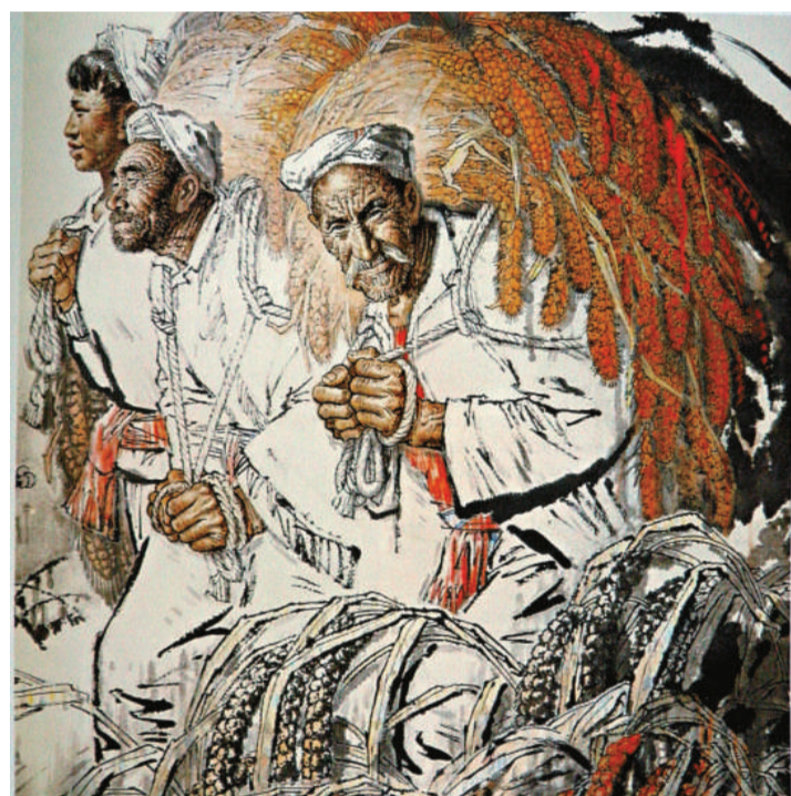
▲劉文西《溝裡人》，一九八二年