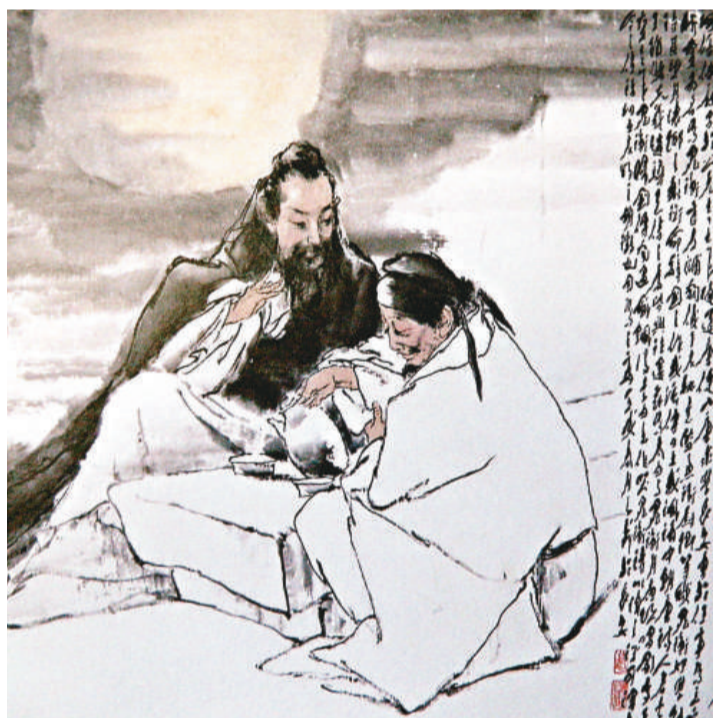
▲王子武《李白與晁衡》，一九八三年