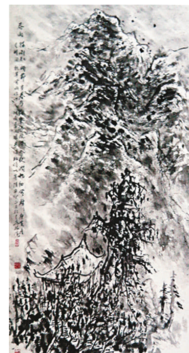
▲崔振寬《春雨》，二〇〇一年