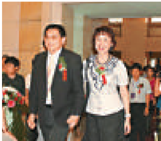
▲東瑞攜夫人參加小小小說節

【本報訊】記者楚長城鄭州報導：「中國鄭州·第四屆小小小說節」日前在河南鄭州舉行，香港作家協會秘書長、香港華文微型小說學會會長東瑞獲授予「小小小說創作終身成就獎」。