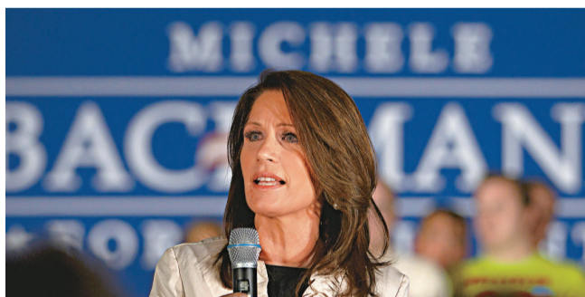
▲明尼蘇達州聯邦眾議員巴赫曼周一在其家鄉愛荷華州宣布參選總統