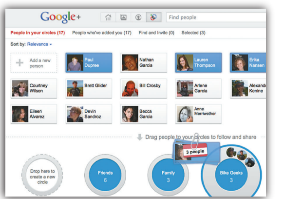
▲谷歌公司28日推出全新社交服務「谷歌+」

圍繞各個「社交圈」，「谷歌+」衍生出各項功能。比如，用戶可通過「火花」在網上搜索針對某特定話題的文章和視頻，並與朋友分享。另一項「交友社區」功能則可提供多方視頻聊天。智能手機版的「谷歌+」支持線上群組聊天，用戶還可選擇對圖片、視頻等進行自動雲存儲以提高文件的載入速度。