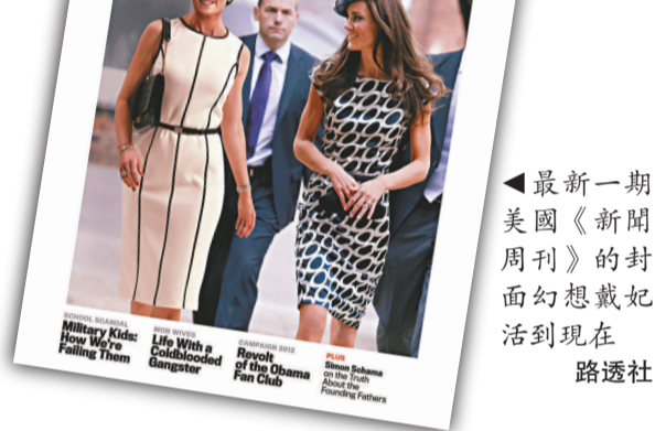
▲最新一期美國《新聞周刊》的封面幻想戴妃活到現在