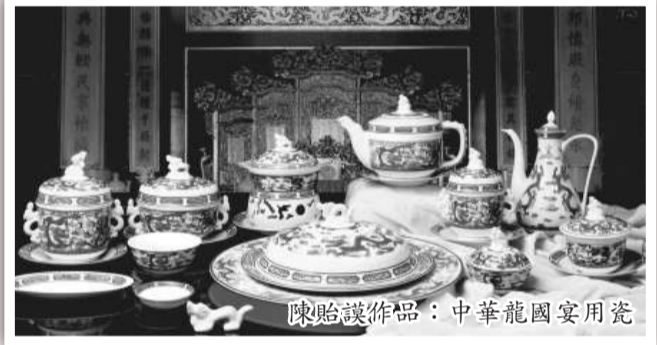
陳貽謨作品：中華龍國宴用瓷