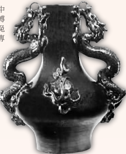
馮乃藻作品：兩點釉雙耳瓶