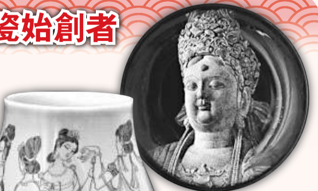
張明文作品：日月觀音