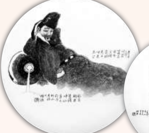
李梓源作品：李白醉酒

1992 年 10 月，在北京中國革命博物館舉辦《李梓源刻瓷藝術展》。1998 年，其作品《李清照》、《芭蕉小鳥》被收入《中國現代美術全集》。