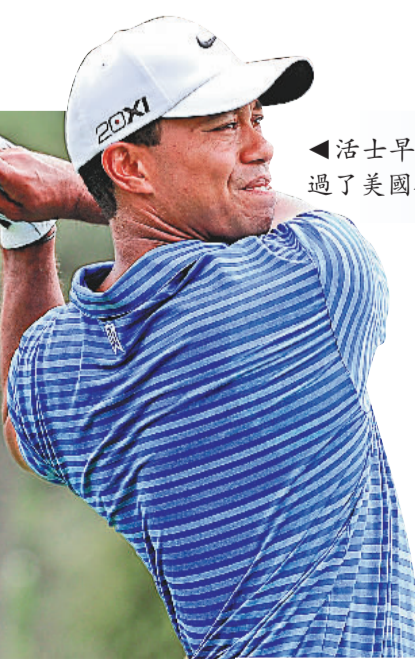
▲活士早前因傷，錯過了美國公開賽

流浪領導層今天會跟巴貝利開會，交代羅致本地球員的進度及討論新季外援配搭，該隊獲前愉園巴西外援湯美及法比奧介紹了大批球員，加上港會推薦的一名澳