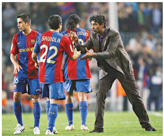
▲列卡特（右）年前曾領軍西甲勁旅巴塞隆拿

【本報訊】據阿拉伯電視台周二報道，前荷蘭國家隊球員、「三劍俠」之一的列卡特與沙特阿拉伯足球總協約3年，出任該國國家隊主教練，目標是帶領球隊躋身2014年世界杯決賽周，這意味著該名前巴塞隆拿主帥將率隊於下月底與香港足球代表隊在世界杯外圍賽中交手。