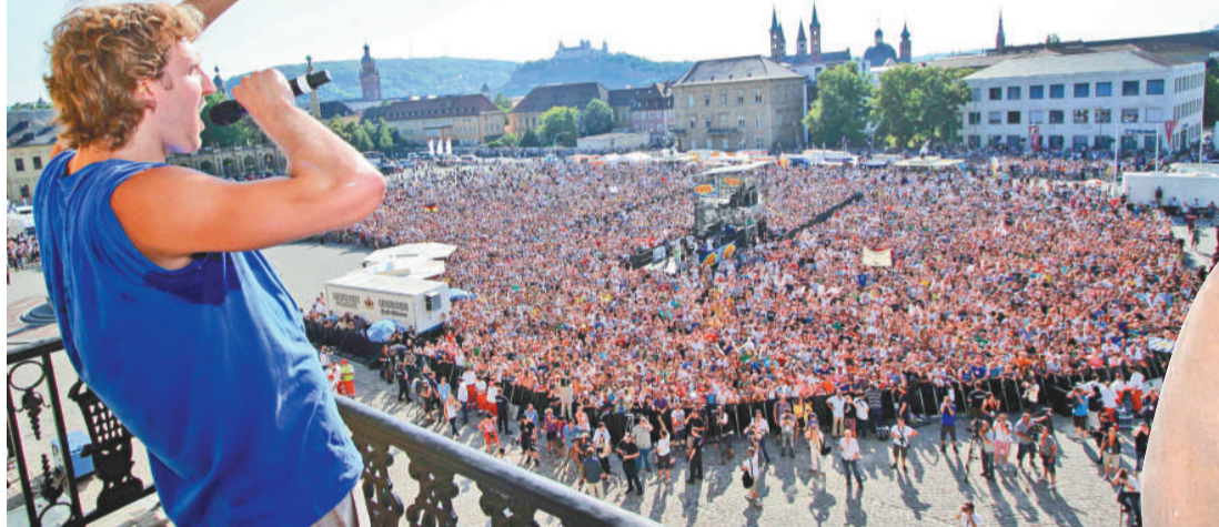
▼魯域斯基（左）面對熱情的家鄉球迷，表現得相當激動

魯域斯基是首名高舉NBA總冠軍的德國球員，爭冠過程中的超卓演出，更為他贏得總決賽最有價值球員（MVP）的榮譽。魯域斯基周二返回家鄉維爾茨堡，便獲得球迷持續不斷的「MVP」喝采聲，他之後到當地的體育館，與全場爆滿的3000名球迷會面。