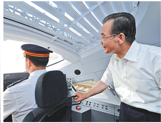
▲溫家寶在首發列車上視察駕駛室