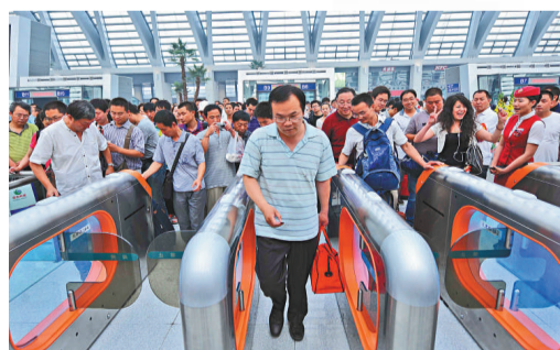
▲天津西站首批旅客開始進站 新華社 ►數名旅客在京滬高鐵南京南站拍照留念 新華社