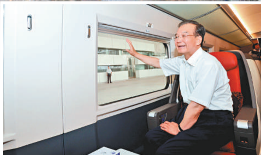
▲溫家寶30日乘京滬高鐵首發列車考察運營情況