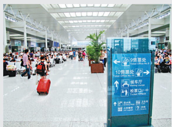
▲京滬高鐵虹橋站是高度現代化的中國鐵路客運特等站

他進一步指出，目前中國鐵路沒有因高鐵技術與外國公司發生知識產權糾紛。中國在建造高鐵的過程中十分重視對知識產權的創造、保護、管理和應用。