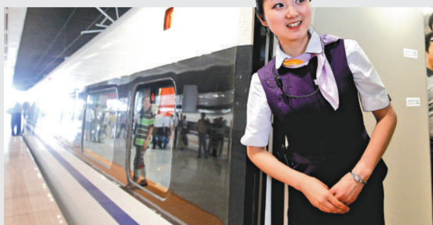
▲京滬高鐵乘務員在鐵路南京南站迎接旅客