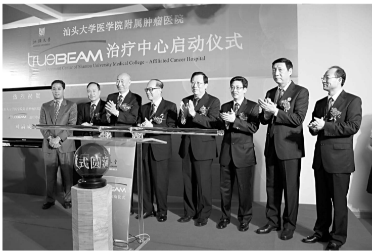
▲李嘉誠（左四）與汕頭市委書記李峰（右三）為汕頭大學醫學院附屬腫瘤醫院 TrueBEAM 治療中心啓動

由「李嘉誠基金會」捐贈的遠東第一台 TrueBEAM 治療設備在汕頭大學醫學院附屬腫瘤醫院啓動，這台價值數百萬美金的設備主要用於癌症的放射治療。6月28日，汕頭市委書記李峰陪同李嘉誠親臨該院參加啓動儀式。