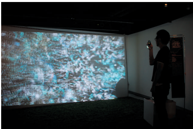
▲互動裝置「虹關」，用多幅Facebook上的相片組合成巨幅馬賽克圖像