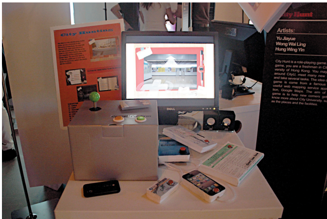
▲「City Hunt」是為新生熟悉城大校園環境設計的角色扮演遊戲

亦有同學將聲控燈裝置置於衣物上，設計者所穿「Tee恤」上的燈管隨着周圍的聲音而變幻明暗。