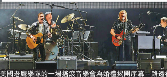
▲美國老鷹樂隊的一場搖滾音樂會為婚禮揭開序幕