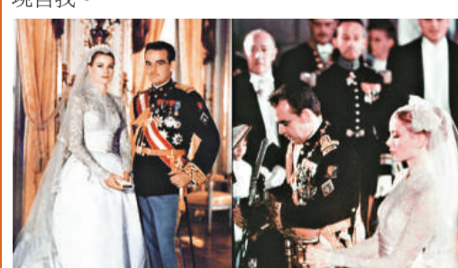
▲前王妃嘉麗絲姬莉與蘭尼埃三世大婚時的資料圖片

摩納哥對外宣傳策略，刻意強調維特施托克「金髮、碧眼、皮膚白皙」。然而，在摩納哥人心中，維特施托克仍遠不及上一代傳奇王妃嘉麗絲姬莉。法國《新觀察周刊》30日指出，維特施托克在嘉麗絲姬莉的龐大傳奇陰影下，恐難表現自我。