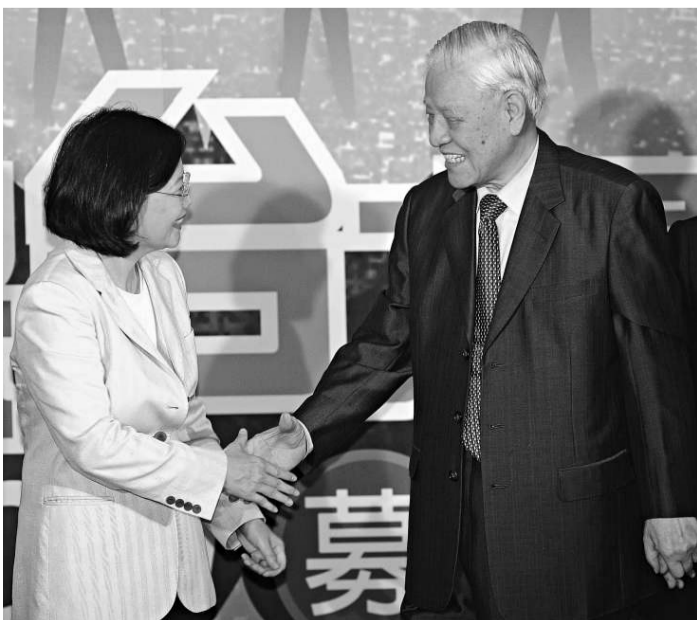
▲李登輝被控「國安密帳」案，難免也將蔡英文捲入，李蔡關係「相提是共犯，不提是切割」，讓蔡英文重陷當年面對陳水扁的尷尬情境。圖為李登輝（右）、蔡英文（左）1日晚出席「台聯黨」募款餐會時握手

【本報訊】據《聯合報》1日報導，陳水扁因扁家弊案被調查期間，曾持洗錢資料告發李登輝也涉及美金5000萬元（合新台幣10餘億元）的洗錢案，請求一併偵辦，特偵組已將李登輝5名隨隨陳國勝、李忠仁、鄭光麟、廖松青、李志中聲請入出境管制，後續將調查李登輝是否如扁一樣海外洗錢。 特偵組主任陳宏達中午指出，特偵組確有偵查此案，且有進度，已請熟悉案情的檢察官負責蒐證，近期曾透過法務部檢察司單一窗口，向新加坡檢察總署就此案聲請司法互助，但偵辦「國安」密帳案5月31日傳訊李登輝時，並沒有就此對李偵訊，如有進一步明確證據，將再行決定後續偵查作為。 陳水扁2008年9月5日前往台北地檢署就前「調查局長」葉盛茂隱匿公文案作證時，當庭向當時仍在台北地檢署偵查組辦案的主任檢察官郭永發告發李登輝，台北地檢署依法將案件移轉特偵組，由特偵組簽分「特查案」偵辦，李登輝列被告。 特偵組同年10月15日將陳水扁告發的5名「國安局」現任、卸任李登輝隨境管，並在劉泰英因新瑞都案在監服刑時，指派檢察官到台北監獄就訊劉泰英，案情發展中，檢方會等待星