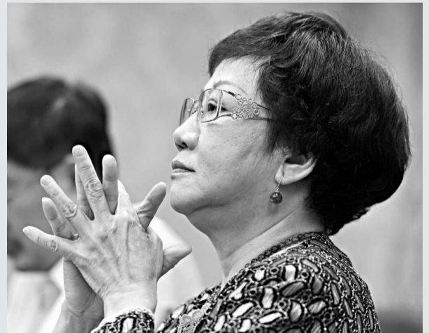
▲呂秀蓮1日在台北舉行記者會時表示，若明年的選舉有任何閃失，蔡英文須承擔歷史責任 中央社

【本報訊】據中央社1日報導：民進黨日前通過不分區立法委員提名名單，前副「總統」呂秀蓮今天表示，民進黨主席蔡英文擁有空前的權力，若明年「總統」、立委選舉有任何閃失，蔡英文須承擔歷史責任。 呂秀蓮上午舉行記者會表示，蔡英文是「總統」參選人，又掌握相當的立委提名權，是歷屆權力最大的黨主席；但權力愈大，責任愈大，希望蔡英文體認要為明年選舉承擔歷史責任。如果明年勝選，功勞大；若有任何閃失，需承擔歷史責任。 她說，從這次不分區立委提名案看，做為民進黨員，有權拜託公布名單討論過程、提名委員意見；如果能做到，大家會支持蔡英文明年領導台灣；如果決策過程含糊、閃爍，支持者有權要求改進。 至於前「總統」李登輝因「國安密帳」案遭起訴，她說，選民用民主方式選出的2名「本土總統」，卸任後被起訴，這是全體台灣人共同恥辱，應深入探討背後的問題，請大家哀矜勿喜、嚴肅面對，不可幸災樂禍；李登輝案已進入司法程序，希望未來要兼顧被告人權。