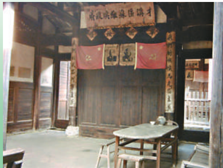
▲才溪區蘇維埃政府舊址 網上圖片