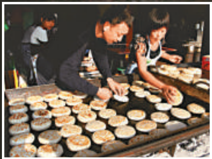
◀商販在製作肉麥餅