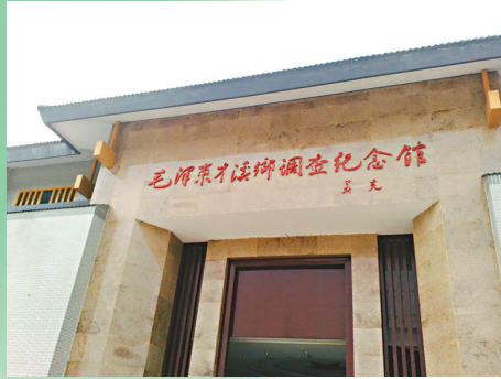
▲毛澤東才溪鄉調查紀念館