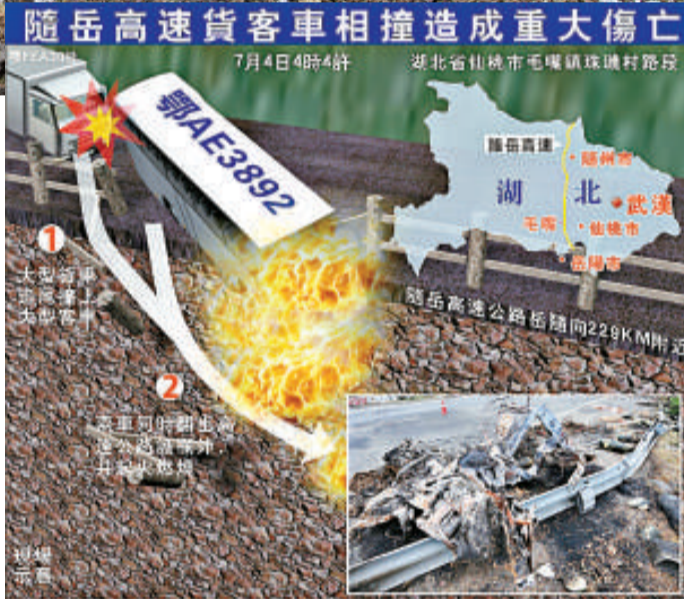
▲4日凌晨，湖北隨岳高速公路發生兩車追尾事故，導致23人死亡、29人傷。圖為消防官兵抬出受傷人員

湖北省交警總隊高警支隊通報，事發時車牌號「鄂AE3892」的大客車搭載52名乘客（包括5名兒童），該車在事發路段的應急車道內違停落客，被後面一輛滿載冬瓜的「鄂FEA30掛」大型貨車追尾相撞，造成兩車翻出高速公路護欄外起火燃燒，多人葬身火海，貨車司機當場死亡。