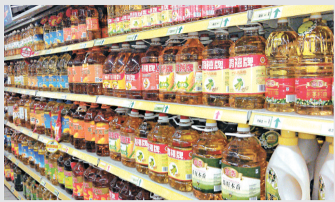
▲深圳超市各類食用油庫存足夠，知名食用油佔據了貨架

【本報記者薛鈴文深圳四日電】連漲十個星期的豬肉助推6月的CPI指數上漲，漲幅將達6.2%。貼近民生的「菜籃子問題」成為這兩個月來人民最關注的焦點。但深圳市民暫時不用為食用油漲價的問題煩惱，國家已下令將食用油的「限價令」延長至8月中旬。