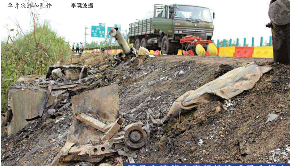
車禍現場到處是燒燬的大客車車身殘骸和配件