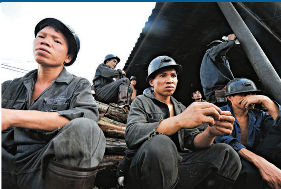
◀在發生事故的廣西合山煤業公司八礦樟村井井口外，由於一氧化碳嚴重超標被迫中斷的部分救援工作已經恢復，救援人員等候下井開展救援工作

目前淮南礦業集團正剖析事故原因，吸取事故教訓，舉一反三，查隱患、定措施、嚴問責，確保礦區安全生產。