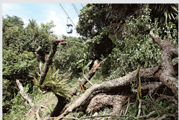
滇老樹倒塌壓索道四死傷 3日上午，在雲南西雙版納野象谷景區，由於雨後一棵老樹倒塌壓毀索道反彈，將纜車上的五名遊客掀翻並掉落地面，事故造成一人死亡三人受傷。目前，三名傷者已全部送到醫院救治，經醫院檢查，均無生命危險。圖為事故現場。

該負責人表示，店舖捐款的10元都是自願的，如果不交也可以，「這邊商戶有30%沒有交這個錢，這些錢每筆都有記錄，清清楚楚，都是可以查到的。」 有部分店主接受採訪時表示，自己正在這一帶做生意，聯防隊長期都在這裡巡邏，所涉也就十塊錢，不算大事，「交了錢，假如有人鬧事，打個電話，他們也跑得快，對不對？」