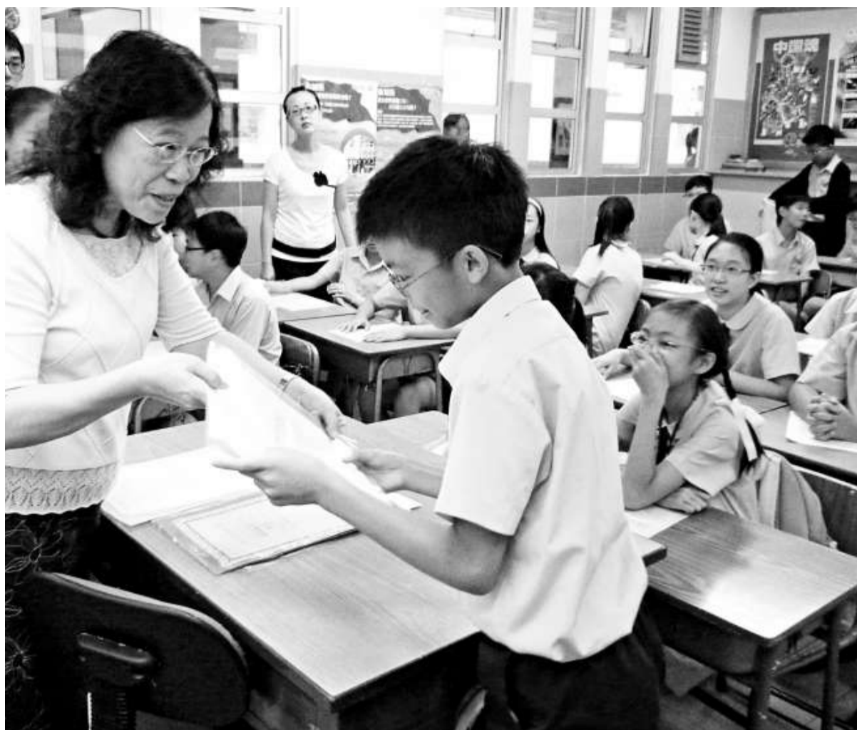
▲今年升中派位，八成四人獲派入首三志願

此外，本年度共有四十一名符合資格的「港人子弟學校」深圳小六生參加本年度的中學學位分配辦法，全部獲派香港中一學位。