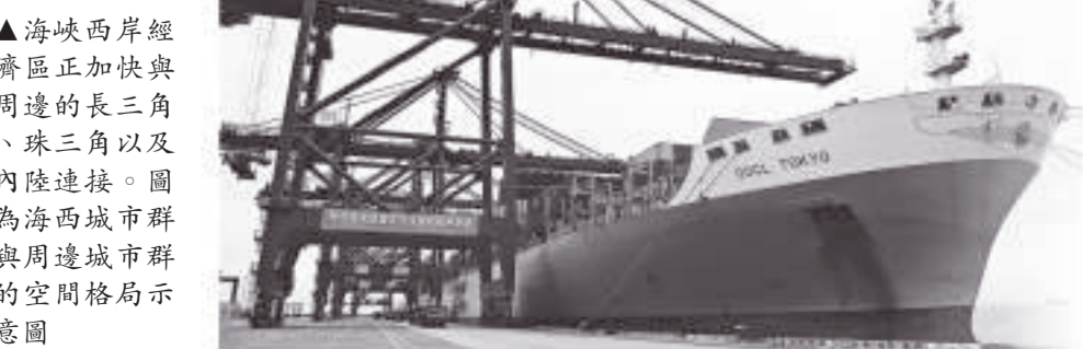
▲海峽西岸經濟區正加快與周邊的長三角、珠三角以及內陸連接。圖為海西城市群與周邊城市群的空間格局示意圖

海岸線全國第二，港口深水岸線居全國首位。如何將港口群建設作為突破口，充分利用優良港口資源優勢，構建現代化、集約化、規模化的海西港口群，有效服務能源、重化、製造、服務等臨港產業，服務港口城市的快速崛起？在海峽西岸經濟區的總體布局中，「沿海發展帶」已被列為加快建設的先行區，而無論是臨港產業還是沿海城市群發展，都與港口息息相關。很顯然，港口發展已經成為海峽西岸經濟區建設的戰略重點，港口興，則海西興。