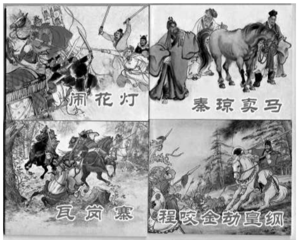
▲在昔日精神食糧還很匱乏的年代，小人書曾是許多人童年的樂趣，而今頗具懷舊意味。