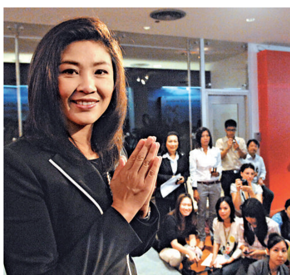
▲泰國候任總理英祿8日在曼谷舉行記者會