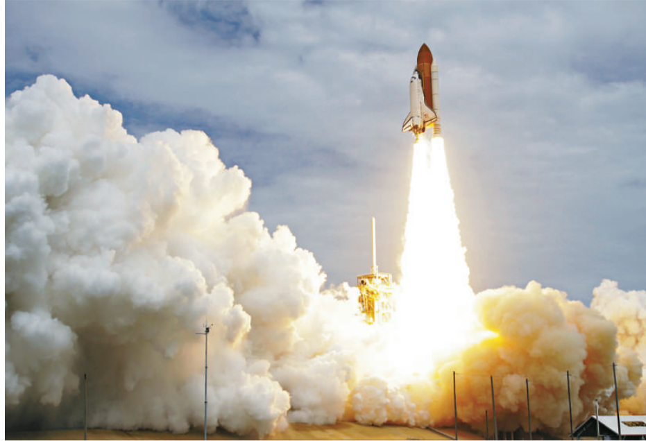
▲美國穿梭機「阿特蘭蒂斯」號8日升空，展開告別之旅

「阿特蘭蒂斯」號完成最後任務後，俄羅斯將壟斷載人太空船市場。未來數年美國將改為租用俄羅斯的太空船，讓美國太空人員前往國際太空站進行太空任務。