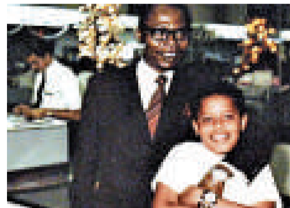
▲1960年代，奧巴馬（右）與父親老奧巴馬合影

雅各布斯曾訪問奧巴馬還有鄧納姆家族的成員，他們都強調奧巴馬的母親一直都想把奧巴馬留在身邊。