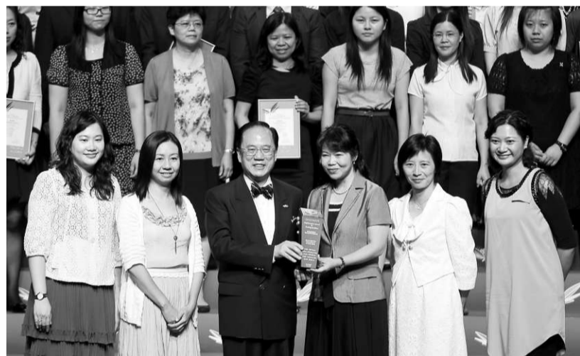
▲曾蔭權（前排左三）向卓越教師頒獎