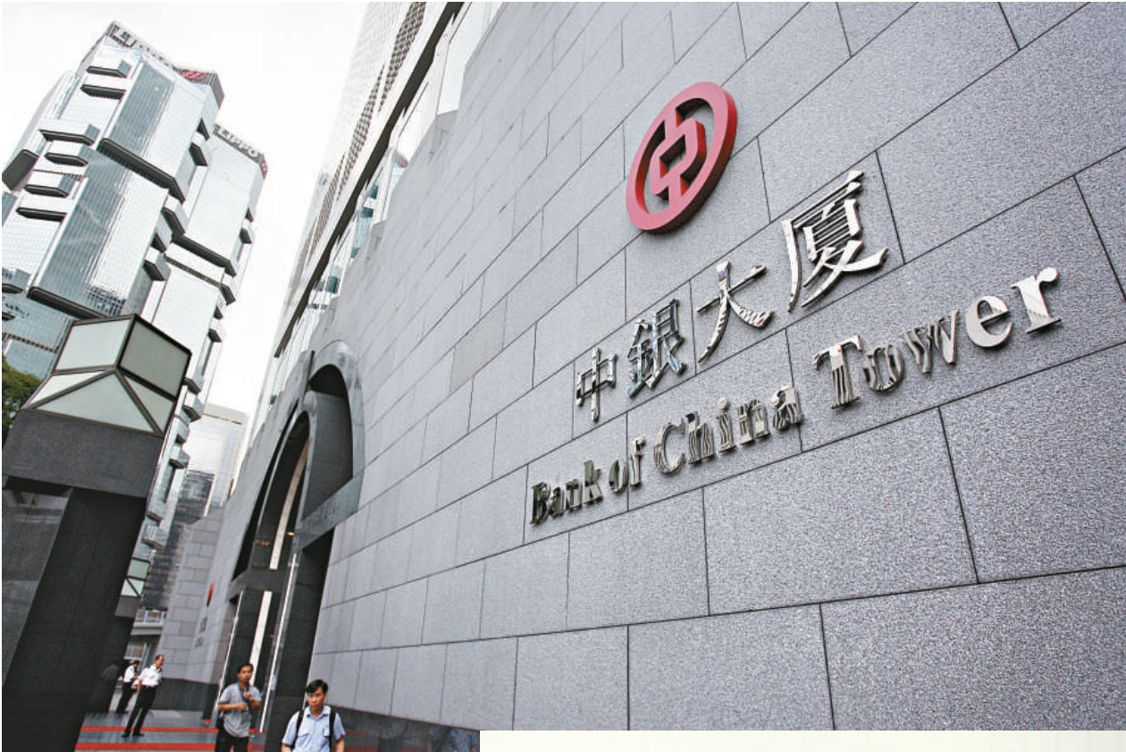
▲中銀香港昨日宣布，上調同業拆息按揭（H按）利率，以及下調最優惠按揭（P按）利率

據了解，中銀香港現時會把參行的人民幣存款，轉往人民銀行在深圳的支行，存款利率為0.72厘；扣除費用後，參行所得利率為0.629厘。