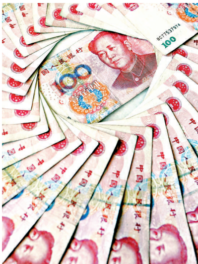
▲中銀香港證實，該行已開始投資內地債券市場

參與人民幣業務的金融機構（或稱參行），需要把持有的人民幣款項存放在清算戶口內。隨着獲批准參與內地債券市場，中銀香港近日開始利用清算戶口內款項，投資內地債券產品。