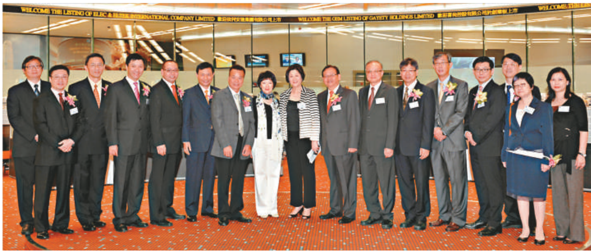
▲依利安達昨以介紹形式上市

至於仍在招股中的盈利時（06838）及匯星印刷（01127），綜合5間券商統計，昨日新借出仔展額依然為零。