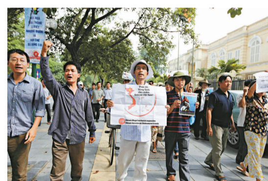
▲越南首都河內10日再次爆發反華示威