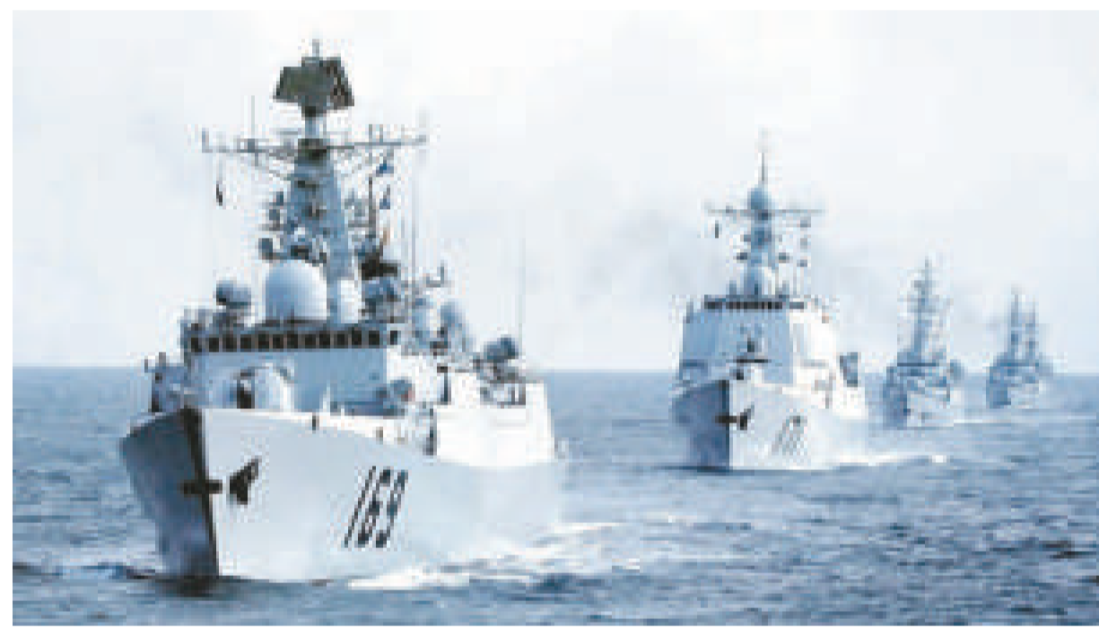
▲中國海軍艦艇在南海海域進行巡邏

據悉，馬倫一行人還將前往山東、浙江等地參觀軍事單位，其中包括二炮（戰略導彈）部隊，預