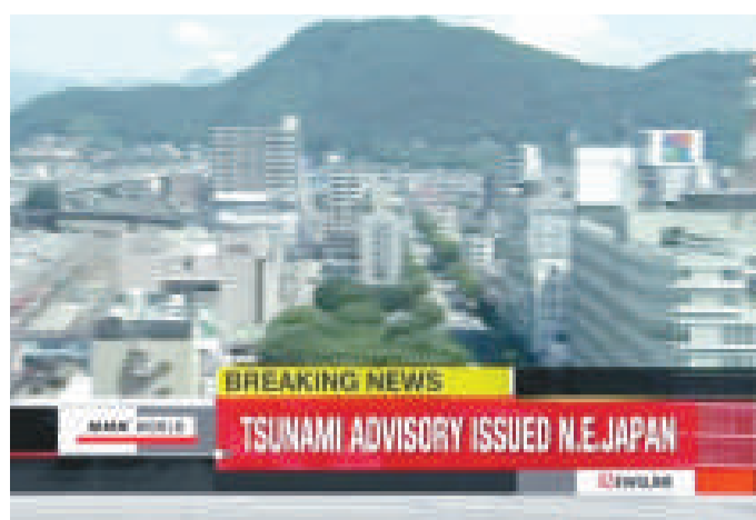
▲日本NHK電視台的畫面拍攝到地震當時搖晃的大街