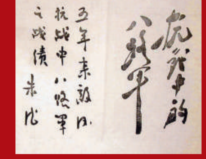
毛澤東與朱德題字

從那個時候起直到現在，也已快到五個年頭了。這五年來八路軍沒有辜負全國同胞的熱望，實現了自己的志願，給了全國抗戰以有力的支持和配合。五年來，華北敵後抗戰的堅持是艱苦的，困難的，是費了無數先烈的頭顱和鮮血的代價換來的，是敵後所有軍民的英勇奮鬥的精神換來的。但是，敵人的殘暴不能摧毀我們，險惡的困難也是不能嚇倒我們，我們已