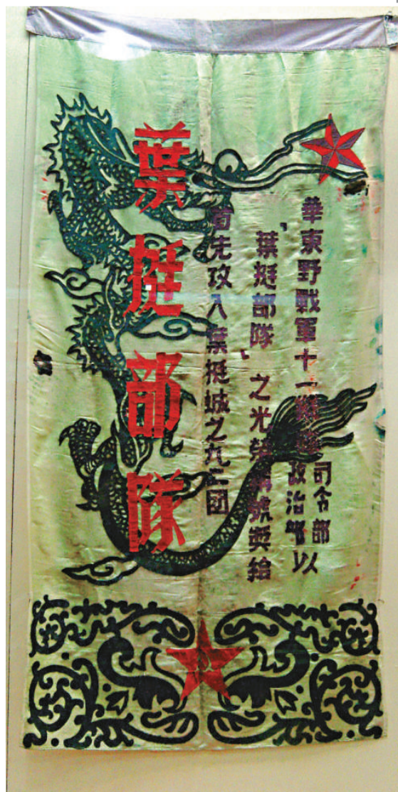
代表葉挺部隊的旗幟