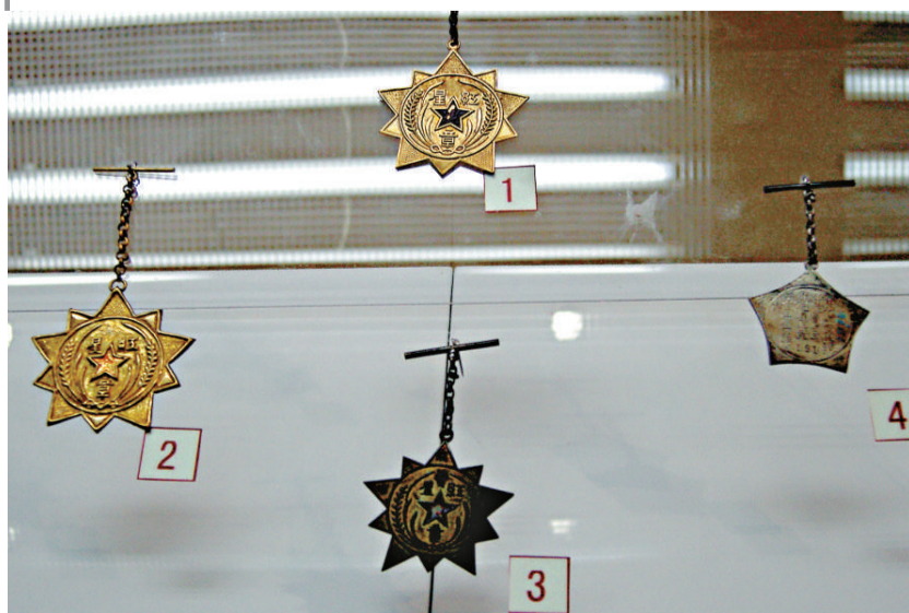
紅軍最高獎勵——紅星獎章