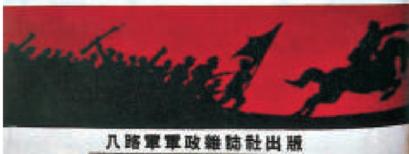
八路軍軍政雜誌社出版