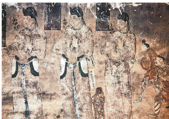
▲榆林窟第29窟南壁東側壁畫「供養人及童僕（西夏）」