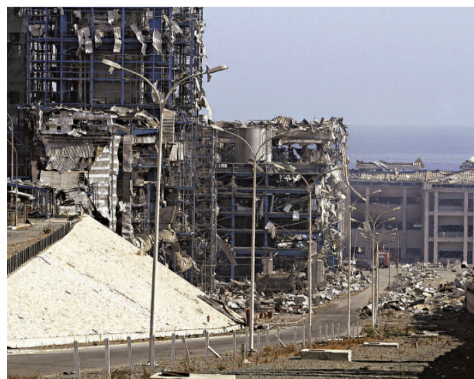
▲塞浦路斯南部電力設施在爆炸中嚴重損毀

當天早些時候，一列由加爾各答駛往北方邦的火車在車站出軌，死亡人數增至80人，超過300人受傷，當地報導指，司機疑因避開正穿越路軌的行人，突然啟動剎車，結果車頭以及十多節車廂出軌。