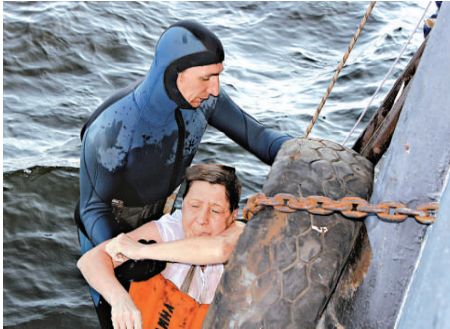
▲俄沉船倖存者與激動的親人見面