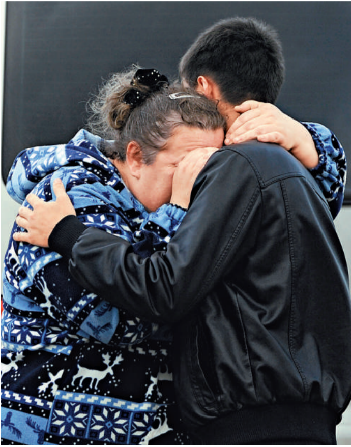
▲有親友在等待失蹤者消息時，不禁焦急痛哭