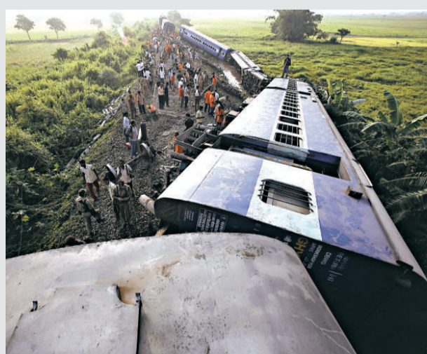
▲印度一輛客運列車遭炸彈襲擊後出軌

【本報訊】據新華社新德里11日消息：印度東北部阿薩姆邦10日深夜發生客運列車遭炸彈襲擊後出軌事件，造成至少100人受傷，其中20人傷勢嚴重。