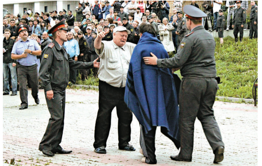
▲俄救援人員從沉沒的客輪裡撈出一具屍體

【本報訊】據中新社、俄新社、法新社莫斯科11日消息：俄羅斯緊急事務部11日說，一艘搭載208名乘客的郵輪「布加爾」號10日在伏爾加河沉沒，造成至少50人死亡、78人失蹤，其中包括至少30名兒童。