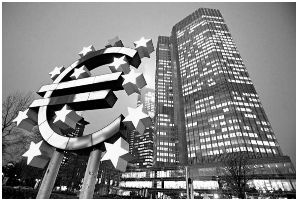
◀ 歐元前景極不明朗，無可避免要重組，部分成員國退出歐元區的機會甚大