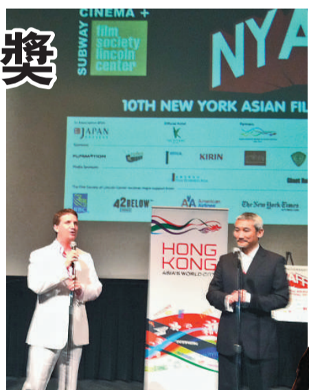
▲徐克（右）在紐約獲「亞洲星終身成就獎」 ▶李冰冰在北美也有粉絲，令她喜出望外

徐克說，他少年時代曾經生活在「文革」的樣板戲中，因此對《林海雪原》這部小說有一定的了解，也一直在探討如何用京劇以外的藝術表現形式來詮釋這部小說。他剛剛買到這部小說的版權，目前進入劇本創作階段。徐克表示，他現階段拍電影，力求將現代技術與電影工業的結合做得更好，使電影與時代一起發展。