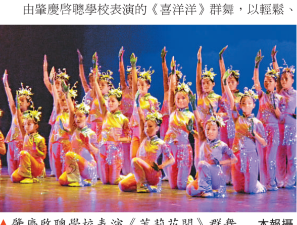
▲肇慶啟聰學校表演《茉莉花開》群舞

【本報訊】記者袁秀賢廣州報導：廣東殘疾人文化節系列活動之第六屆全省特教學校學生藝術匯演，日前一連兩天在廣州黃花崗劇院舉行，來自全省十九支市（區）代表隊，近千名盲、聾、啞、智障等四個殘疾類別的特教學校學生參加，各代表隊表演各顯特色，頗受好評。通過這次匯演，將選拔出優秀的節目和演員，參加下月全國第六屆特教學校學生藝術匯演。