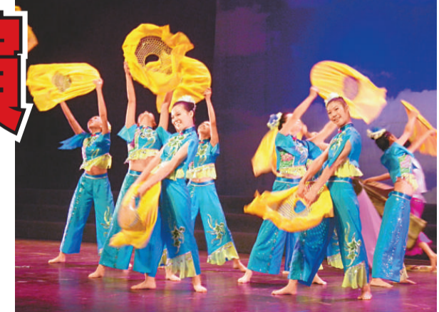
▲聽障學生表演群舞

殘疾人是一個數量眾多、特性突出、特別需要幫助的社會群體，他們無論在生活上、工作上還是學習上都要付出比健全人多幾倍甚至幾十倍的刻苦和努力。特教學校的學生們學習表演一個節目，要進行比健全人更多的練習，尤其是有智力障礙的學生，他們要記住一個句子、一個動作很不容易，要反覆多次的練習，才能把一首歌曲、一場舞蹈完完整整地表演。而特教學校的老師們也功不可沒，為了這次匯演，他們不辭勞苦地為學生一遍一遍地演示和解說，反覆地糾正和指導，目的不是為了一個獎項，而是為了建立學生的自信心和上進心。