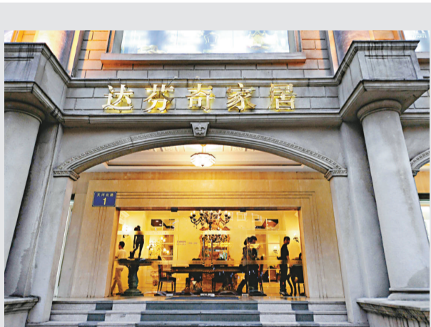
▲廣州市工商局已對達芬奇家居廣州店進行立案調查，並對涉嫌造假的傢具進行封存，等待檢測結果出來再進行依法處理

記者在簽約現場看到，雙方首個啓動項目為「100%低地板有軌電車」。項目落戶珠海市斗門區富山工業園。這種機車採用全球僅有的地面供電系統，其中，在國外領先的無吊掛電力網技術是首次在國內應用。北車集團總經理、北車股份有限公司董事長崔殿國表示，100%低地板有軌電車是綠色節能的現代有軌電車，具有對環境無污染、運力大、運行成本低、方便、快捷、舒適、安全等特點，無廢棄排放問題。