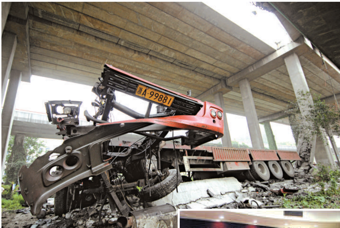
▲杭州錢江三橋輔橋主橋面右側車道十五日凌晨部分橋面突然塌落，一輛重型半掛車從橋面墜落，又將下匝道砸塌。司機跳車受傷，送往醫院救治。圖為從橋面墜落的重型半掛車

早在二〇〇六年十月，錢江三橋完成大修恢復通車後，開始禁止一切貨車通行，但是仍有大量貨車偷跑上橋。據了解，錢江一橋大修、錢江四橋建成前，錢江三