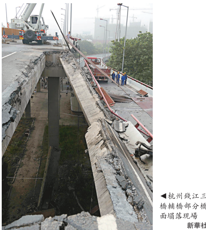
▲杭州錢江三橋輔橋部分橋面塌落現場