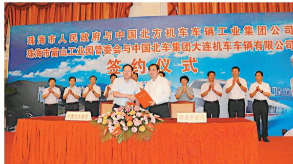
▲珠海市長鍾世堅與北車股份有限公司總裁吳國華簽訂《戰略合作協議》。

【本報記者陳艷君珠海十五日電】珠海市政府十五日下午與中國北方機車車輛有限公司在珠海簽署《戰略合作協議》。根據這一協議，中國北車集團計劃在珠海分期滾動投資逾百億元人民幣，在軌道交通裝備製造為主，包括電傳動與電機電器產業以及城市軌道交通建設等領域，與珠海政府進行全面合作。