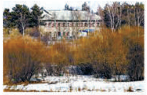
▲俄羅斯兵營舊址