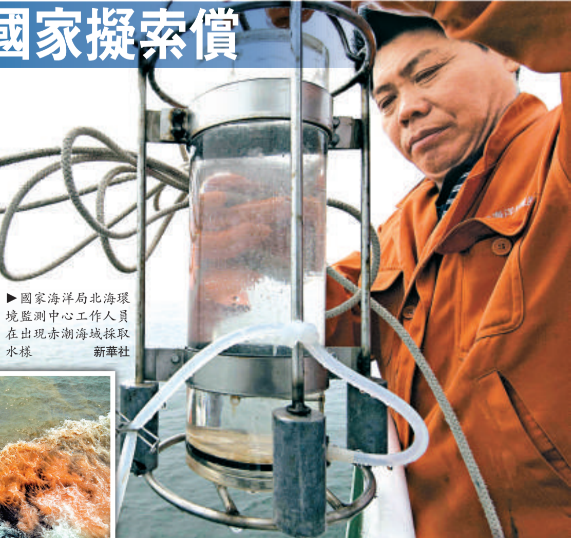
▶國家海洋局北海環境監測中心工作人員在出現赤潮海域採取水樣