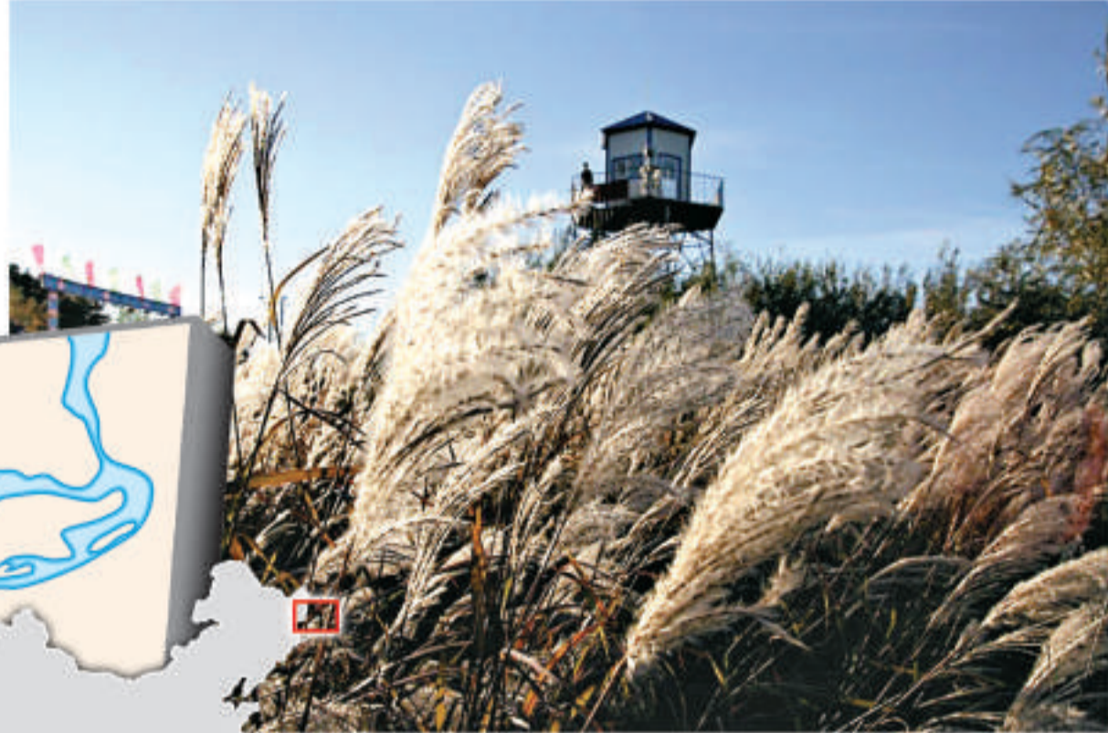
▲黑瞎子島原生態的蘆葦甚至高過人