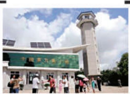
▲烏蘇鎮「東方第一哨」

據了解，當前階段由於島上基礎設施建設尚未全面完成，黑瞎子島的接待條件和景區狀況還不能滿足所有希望登島的遊客的需要。黑龍江省國際旅行社在撫遠設立日常運營機構，統一經營撫遠至黑瞎子島的登島旅遊項目，按計劃安排遊客登島。希望赴黑瞎子島的遊客，可以直接通過各地組團旅行社與黑龍江省國旅聯繫登島遊報名事宜。