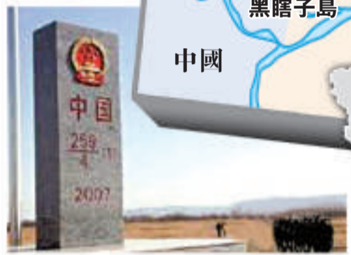
▲中俄黑瞎子島交接紀念地（259號界碑） 網上圖片