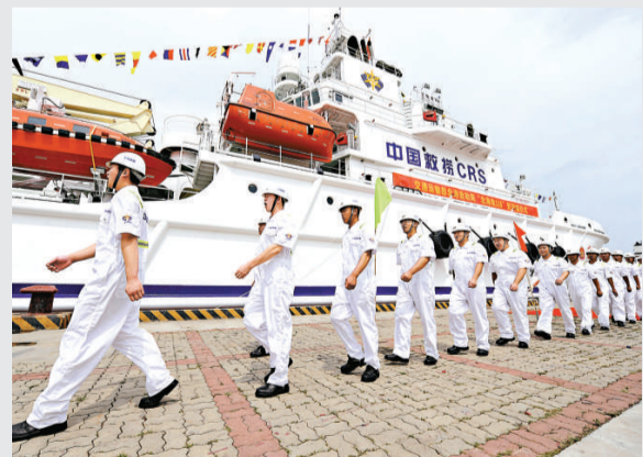
▲中國北部海域再添全天候遠洋專業救助船——「北海救116」

希拉里這次出訪也將訪問印度和印尼，並且出席在峇里島舉行的東亞區域會談；在香港停留期間，她將就全球經濟情勢以及美國的競爭力發表演說。