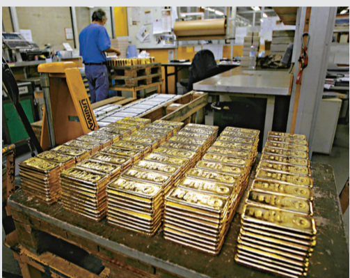
金價連升十個交易日，而累計全個星期金價升幅約3.1%，是連續9個星期錄得升市。

另一方面，花旗集團公布季純利增長24%，符合市場預期水平，亦能成投資者吸納原油的誘因。