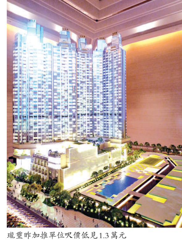
瓏璽昨加推單位呎價低見1.3萬元

預計7月一手加二手註冊量僅5050宗，將為09年2月4007宗之後的29個月新低。