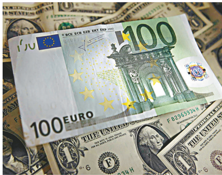
▲歐元兌美元過去一周跌幅超過0.8%